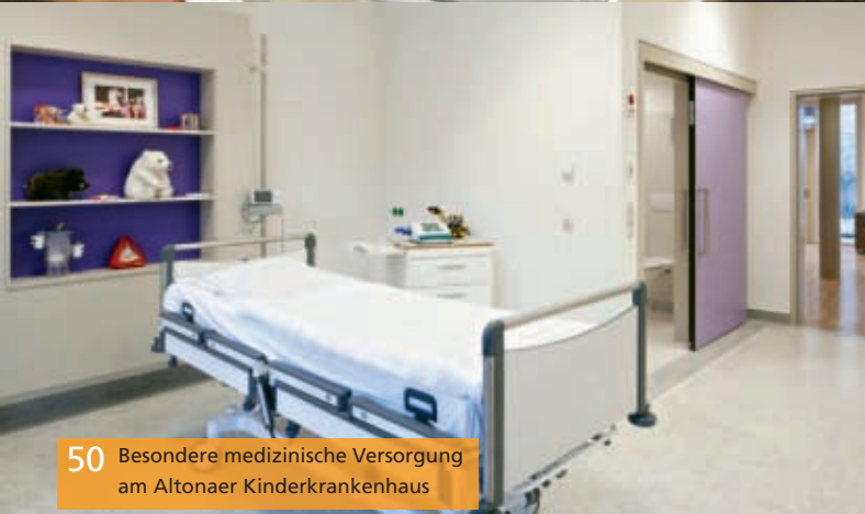
50 Besondere medizinische Versorgung am Altonaer Kinderkrankenhaus