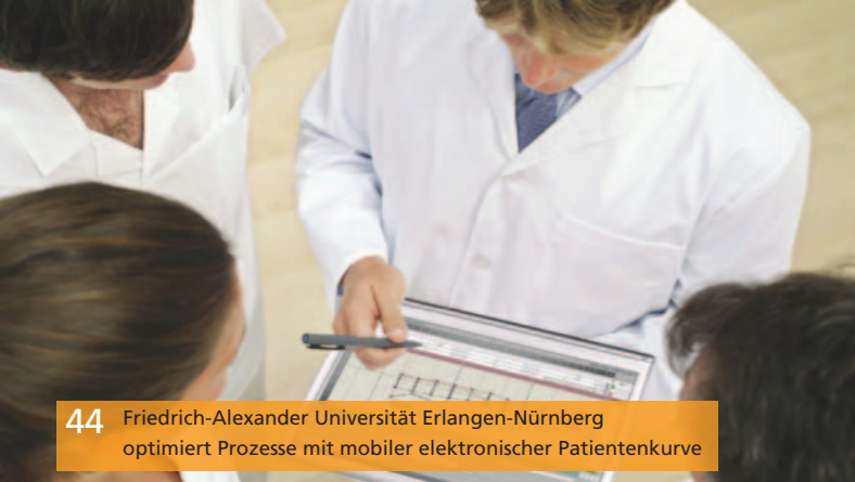
44 Friedrich-Alexander Universität Erlangen-Nürnberg optimiert Prozesse mit mobiler elektronischer Patientenkurve