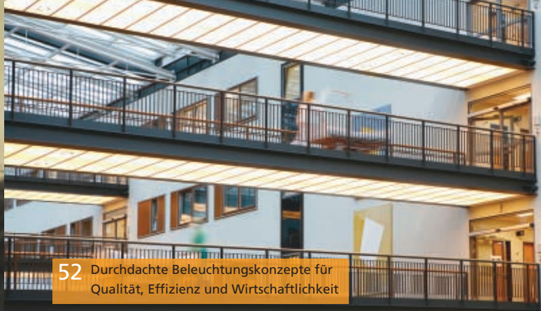
52 Durchdachte Beleuchtungskonzepte für Qualität, Effizienz und Wirtschaftlichkeit