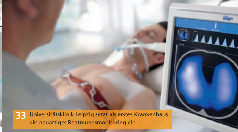
33 Universitätsklinik Leipzig setzt als erstes Krankenhaus ein neuartiges Beatmungsmonitoring ein