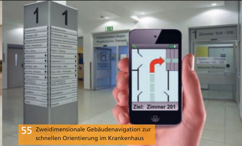
55 Zweidimensionale Gebäudenavigation zur schnellen Orientierung im Krankenhaus