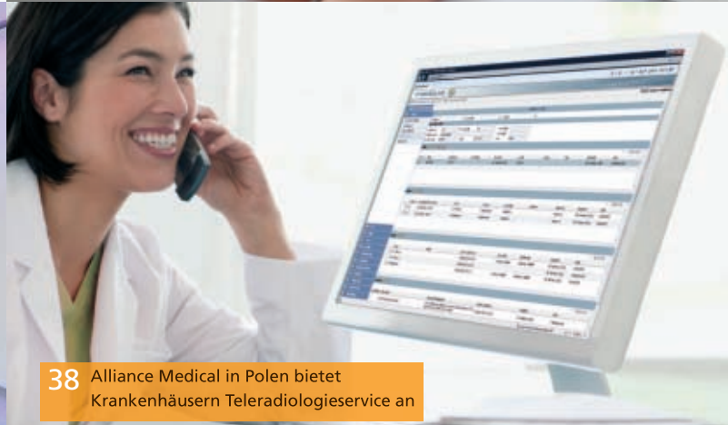
38 Alliance Medical in Polen bietet Krankenhäusern Teleradiologieservice an