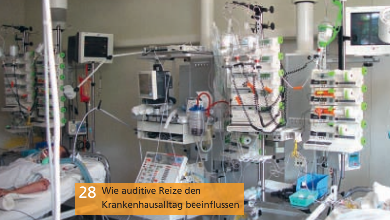
28 Wie auditive Reize den Krankenhausalltag beeinflussen