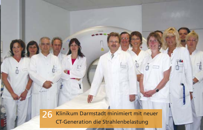
26 Klinikum Darmstadt minimiert mit neuer CT-Generation die Strahlenbelastung