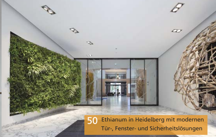
50 Ethianum in Heidelberg mit modernen Tür-, Fenster- und Sicherheitslösungen