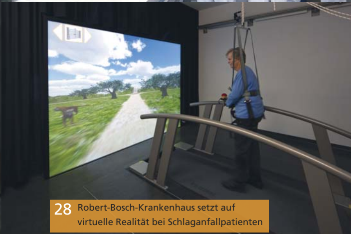
28 Robert-Bosch-Krankenhaus setzt auf virtuelle Realität bei Schlaganfallpatienten