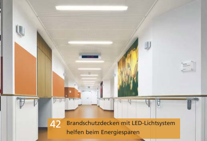
42 Brandschutzdecken mit LED-Lichtsystem helfen beim Energiesparen