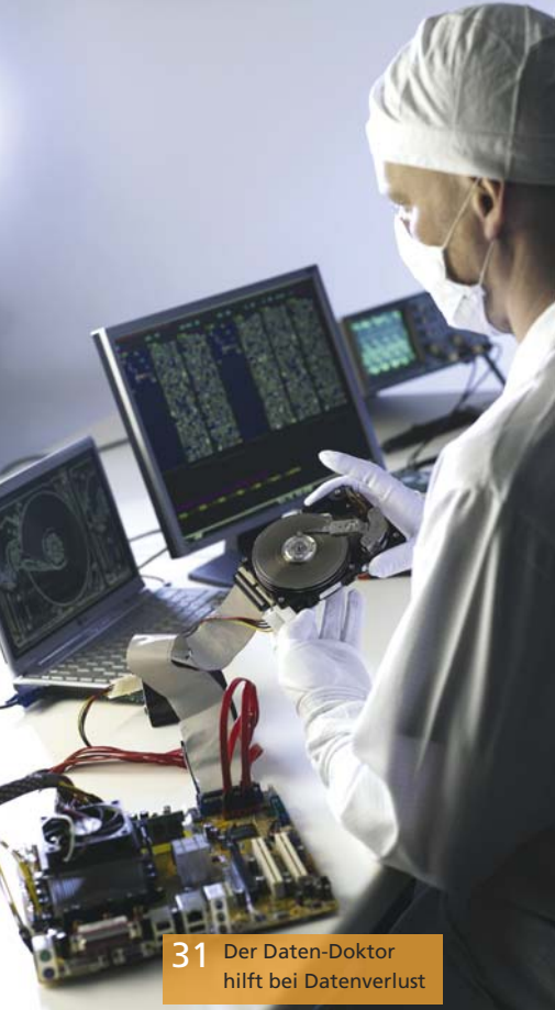
31 Der Daten-Doktor hilft bei Datenverlust