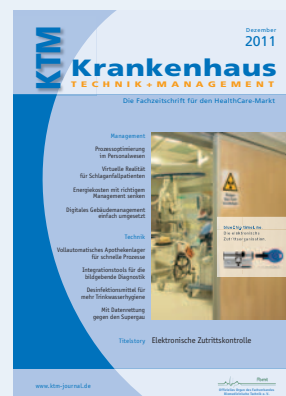
Titelbild: Aug. Winkhaus

Zwischen der Ausschreibung und der Inbetriebnahme der neuen elektronischen Schließanlage im Klinikum Kassel lagen nur drei Monate. In dieser kurzen Zeit wurden ein Zentralgebäude mit moderner Chip-Technologie ausgerüstet und die Schließpläne für den Komplex mit rund 850 Mitarbeitern erstellt. Ein Grund für die reibungslose Realisierung: die gute Zusammenarbeit aller Projektbeteiligten.