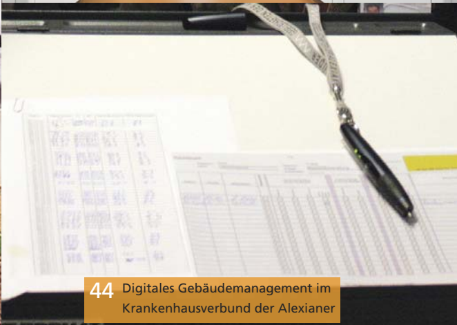
44 Digitales Gebäudemanagement im Krankenhausverbund der Alexianer