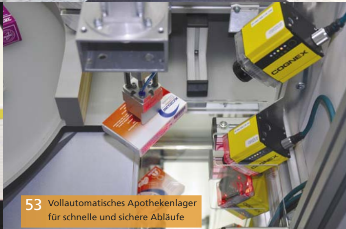
53 Vollautomatisches Apothekenlager für schnelle und sichere Abläufe