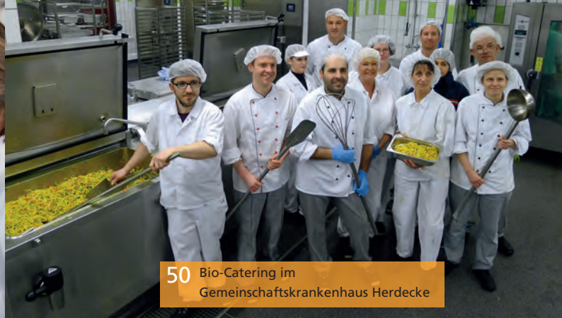
50 Bio-Catering im Gemeinschaftskrankenhaus Herdecke