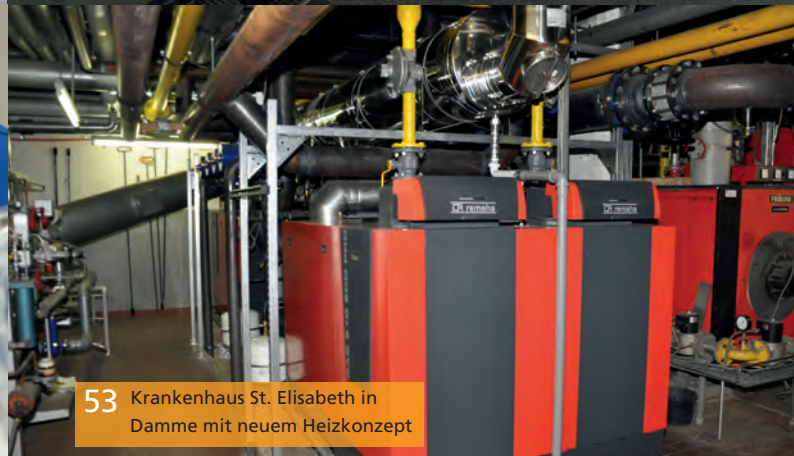
53 Krankenhaus St. Elisabeth in Damme mit neuem Heizkonzept