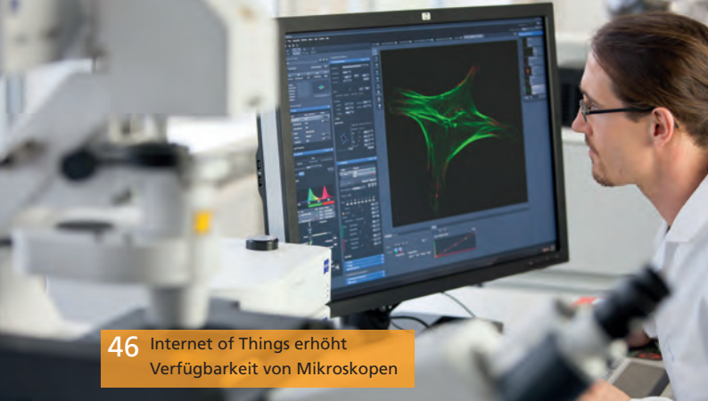
46 Internet of Things erhöht Verfügbarkeit von Mikroskopen