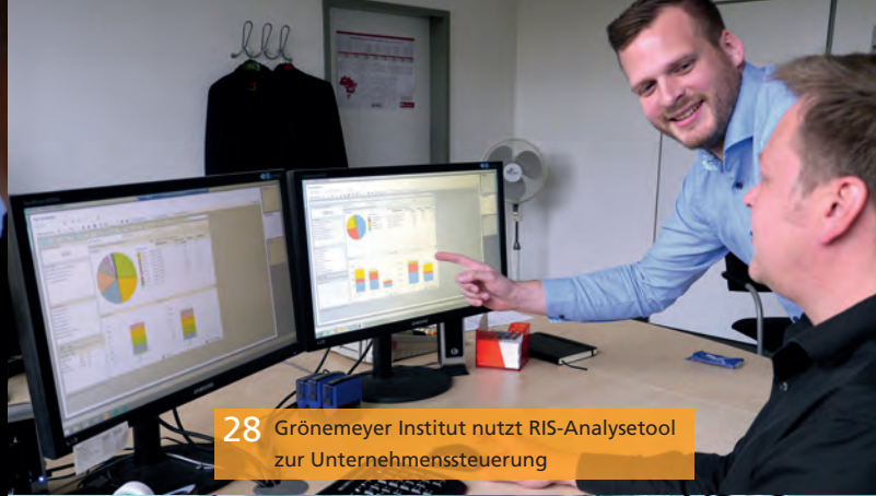
28 Grönemeyer Institut nutzt RIS-Analysetool zur Unternehmenssteuerung