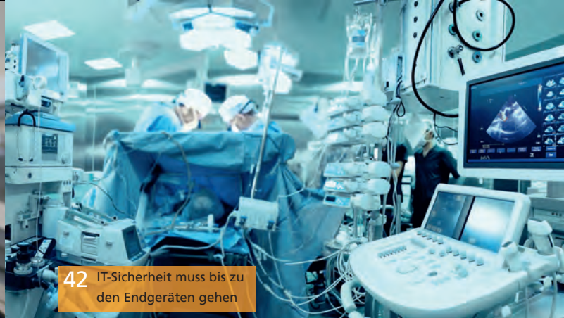
42 IT-Sicherheit muss bis zu den Endgeräten gehen