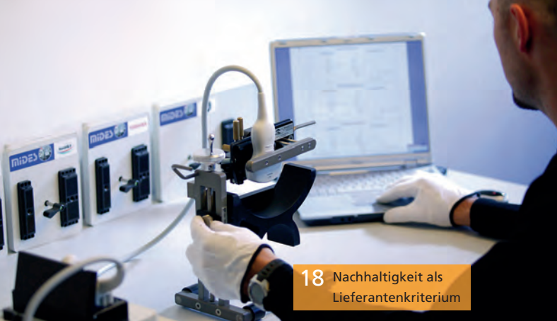
18 Nachhaltigkeit als Lieferantenkriterium