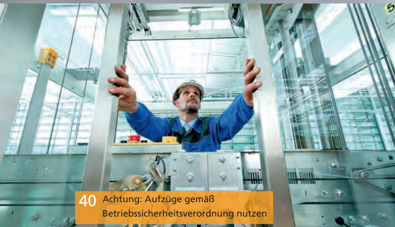
40 Achtung: Aufzüge gemäß Betriebssicherheitsverordnung nutzen