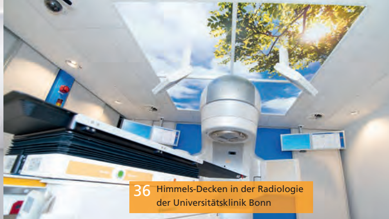
36 Himmels-Decken in der Radiologie der Universitätsklinik Bonn