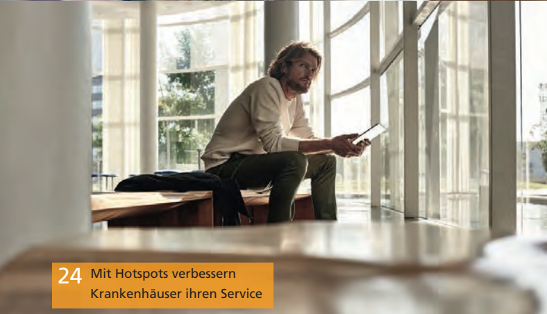
24 Mit Hotspots verbessern Krankenhäuser ihren Service