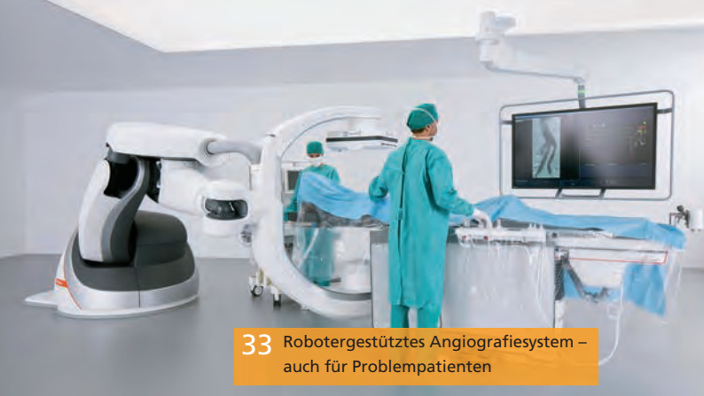
33 Roboter-gestütztes Angiografiesystem – auch für Problempatienten