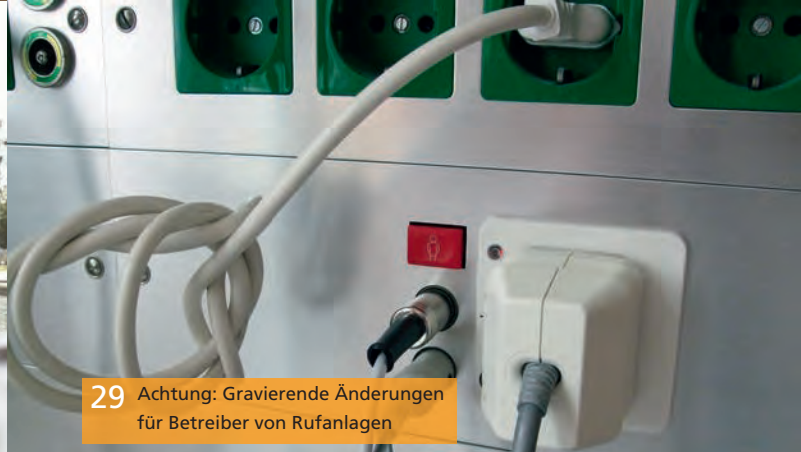
29 Achtung: Gravierende Änderungen für Betreiber von Rufanlagen