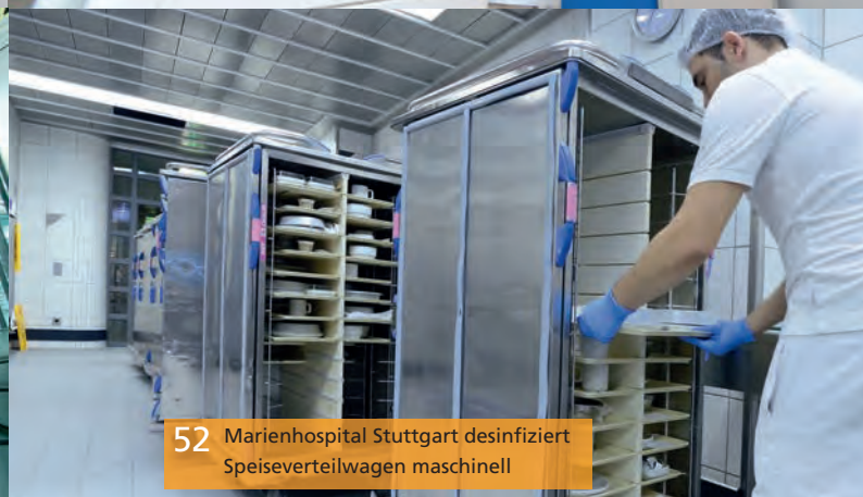
52 Marienhospital Stuttgart desinfiziert Speiseverteilwagen maschinell