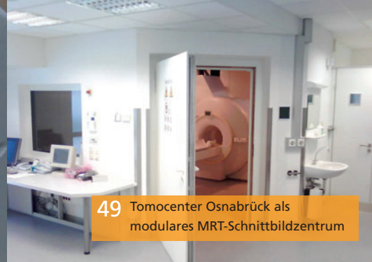
49 Tomocenter Osnabrück als modulares MRT-Schnittbildzentrum