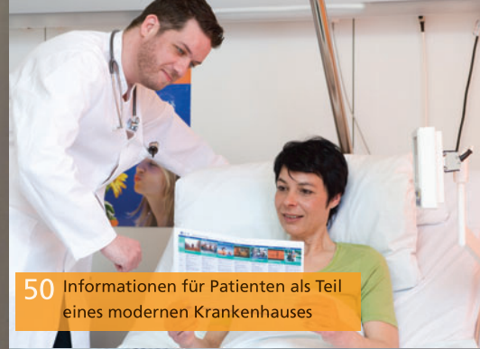
50 Informationen für Patienten als Teil eines modernen Krankenhauses