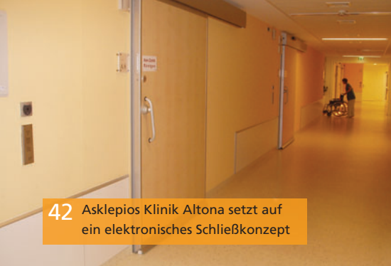
42 Asklepios Klinik Altona setzt auf ein elektronisches Schließkonzept