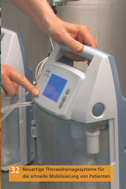
32 Neuartige Thoraxdrainagesysteme für die schnelle Mobilisierung von Patienten