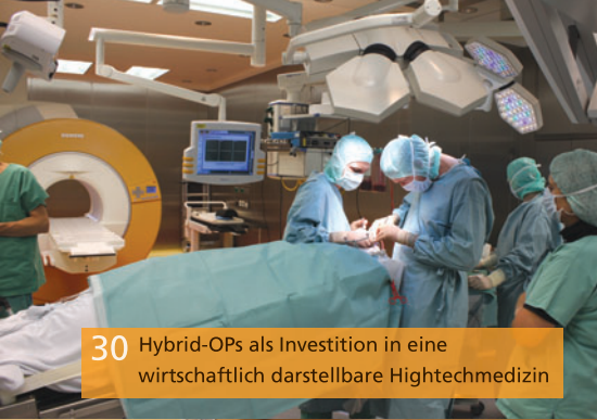
30 Hybrid-OPs als Investition in eine wirtschaftlich darstellbare Hightechmedizin