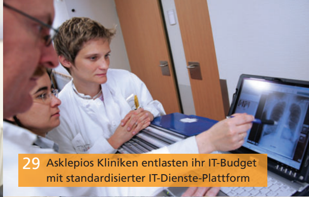
29 Asklepios Kliniken entlasten ihr IT-Budget mit standardisierter IT-Dienste-Plattform