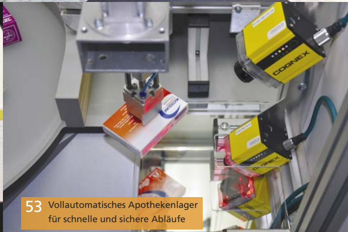
53 Vollautomatisches Apothekenlager für schnelle und sichere Abläufe