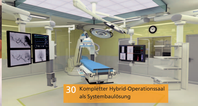
30 Kompletter Hybrid-Operationsaal als Systembaulösung