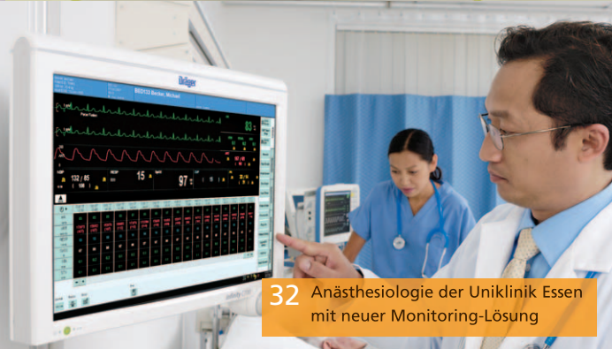
32 Anästhesiologie der Uniklinik Essen mit neuer Monitoring-Lösung