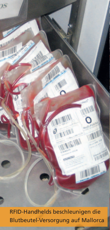
RFID-Handhelds beschleunigen die Blutbeutel-Versorgung auf Mallorca