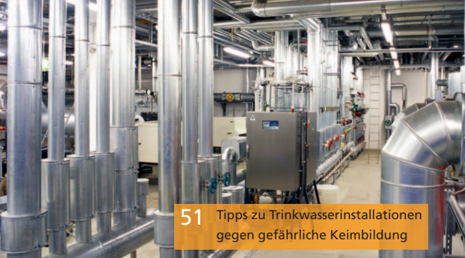
51 Tipps zu Trinkwasserinstallationen gegen gefährliche Keimbildung