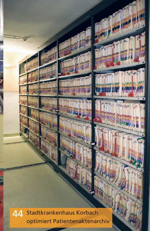
44 Stadtkrankenhaus Korbach optimiert Patientenaktenarchiv