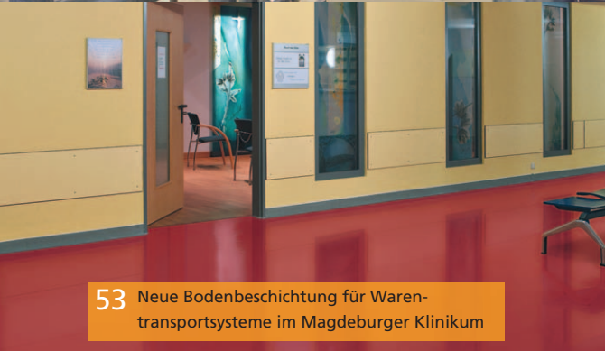
53 Neue Bodenbeschichtung für Warentransportsysteme im Magdeburger Klinikum