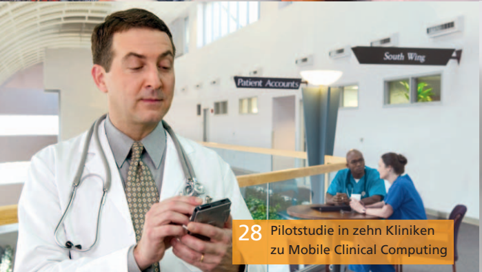
28 Pilotstudie in zehn Kliniken zu Mobile Clinical Computing