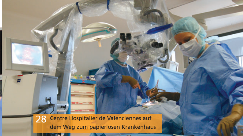
28 Centre Hospitalier de Valenciennes auf dem Weg zum papierlosen Krankenhaus