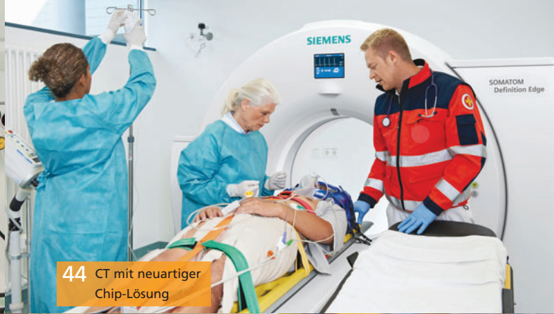
44 CT mit neuartiger Chip-Lösung