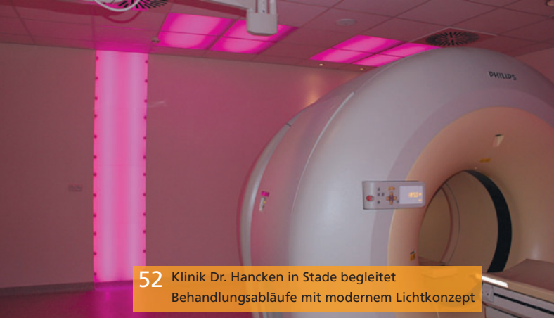
52 Klinik Dr. Hancken in Stade begleitet Behandlungsabläufe mit modernem Lichtkonzept