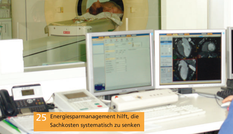
25 Energiesparmanagement hilft, die Sachkosten systematisch zu senken