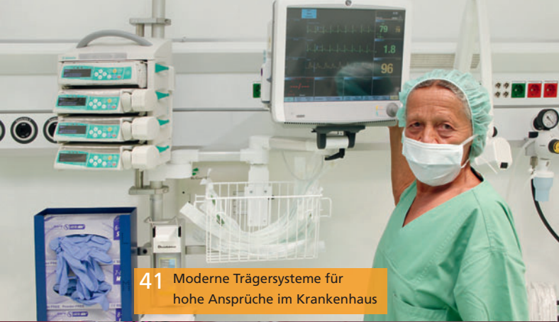
41 Moderne Trägersysteme für hohe Ansprüche im Krankenhaus