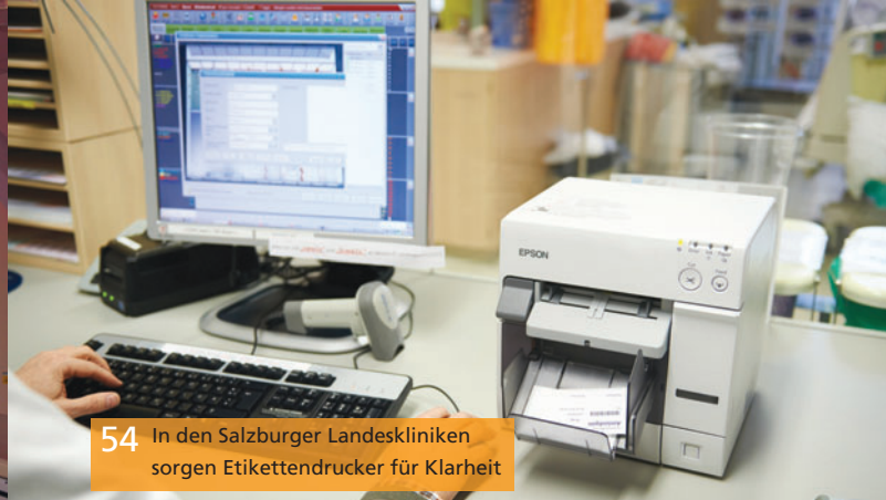
54 In den Salzburger Landeskliniken sorgen Etikettendrucker für Klarheit

Viel Druck für die Gesundheitsbranche Wäscheberge wirkungsvoll und energiesparend trocknen T 58