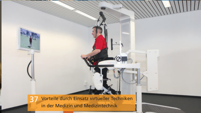
37 Vorteile durch Einsatz virtueller Techniken in der Medizin und Medizintechnik