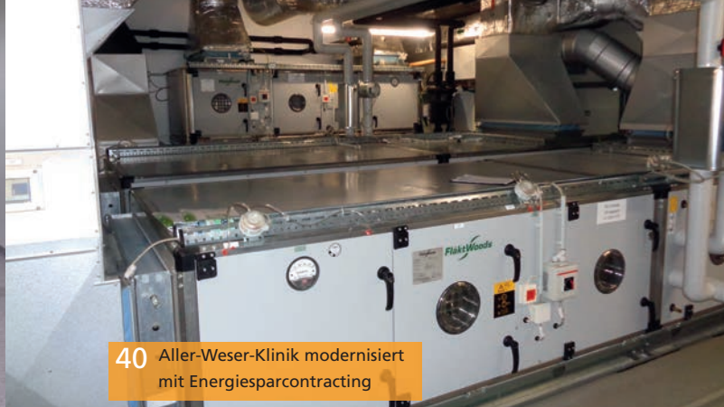
40 Aller-Weser-Klinik modernisiert mit Energiesparcontracting