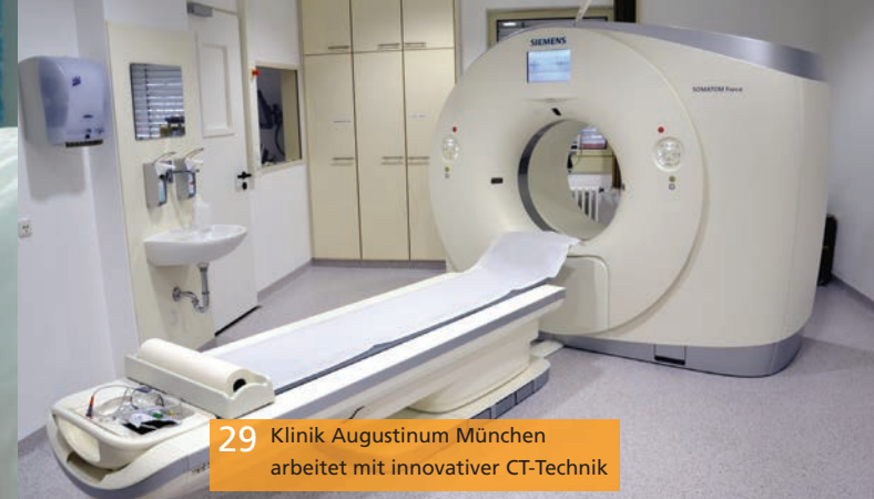
29 Klinik Augustinum München arbeitet mit innovativer CT-Technik