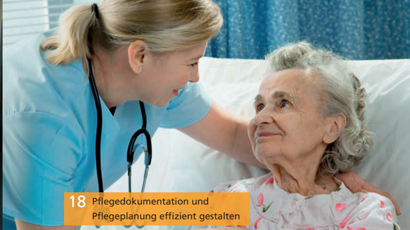
18 Pflegedokumentation und Pflegeplanung effizient gestalten