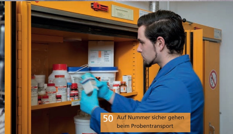
50 Auf Nummer sicher gehen beim Probentransport