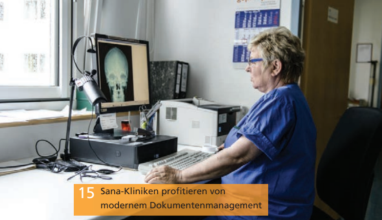
15 Sana-Kliniken profitieren von modernem Dokumentenmanagement