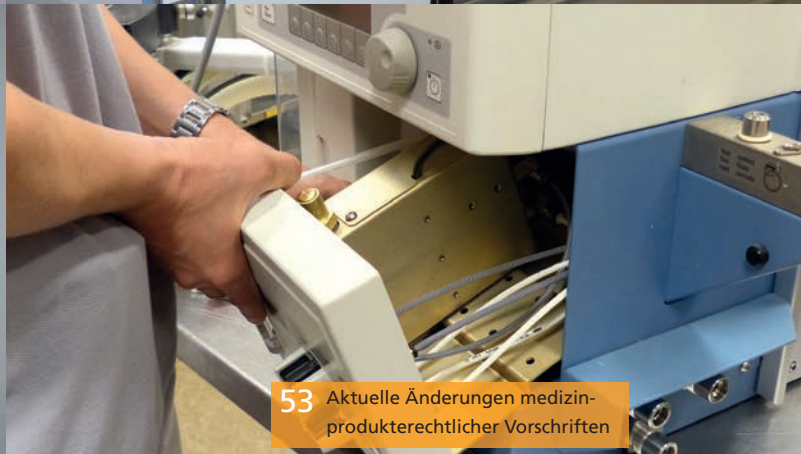
53 Aktuelle Änderungen medizinproduktrechtlicher Vorschriften

Brandschutz für besondere Bereiche Individuell angepasste Löschesysteme für sorgenfreien Brandschutz