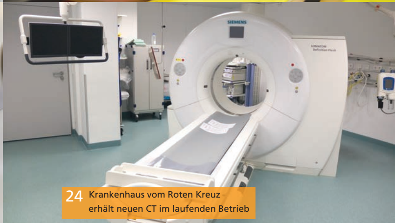
24 Krankenhaus vom Roten Kreuz erhält neuen CT im laufenden Betrieb