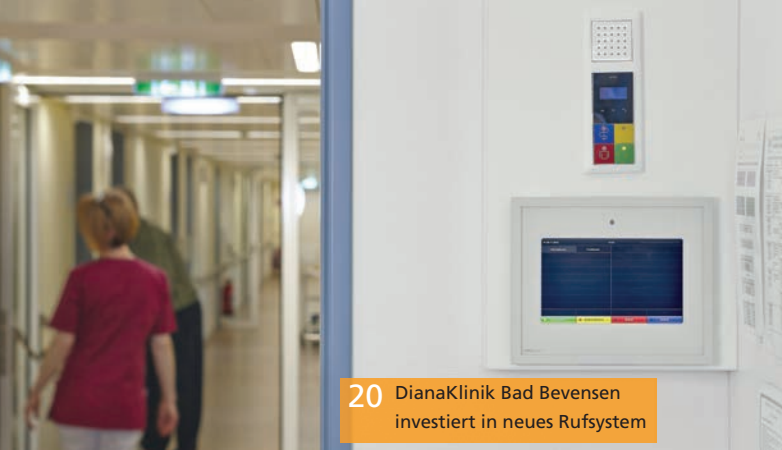
20 DianaKlinik Bad Bevensen investiert in neues Rufsystem