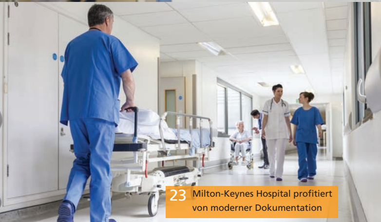
23 Milton-Keynes Hospital profitiert von moderner Dokumentation