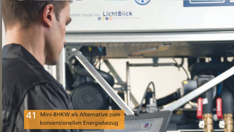
41 Mini-BHKW als Alternative zum konventionellen Energiebezug