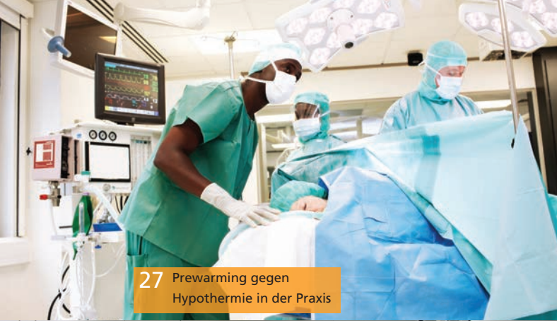
27 Prewarming gegen Hypothermie in der Praxis