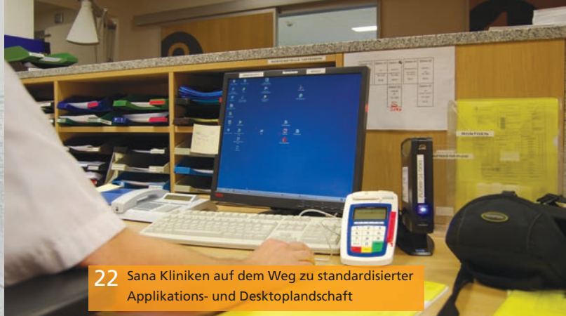
22 Sana Kliniken auf dem Weg zu standardisierter Applikations- und Desktoplandschaft