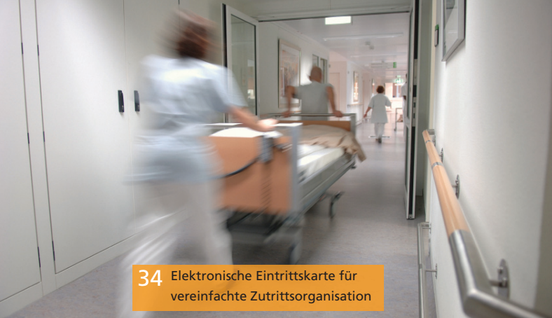
34 Elektronische Eintrittskarte für vereinfachte Zutrittsorganisation