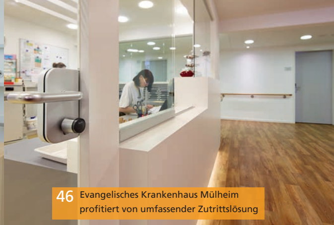
46 Evangelisches Krankenhaus Mülheim profitiert von umfassender Zutrittslösung