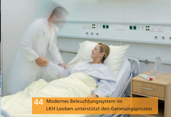
44 Modernes Beleuchtungssystem im LKH Leoben unterstützt den Genesungsprozess