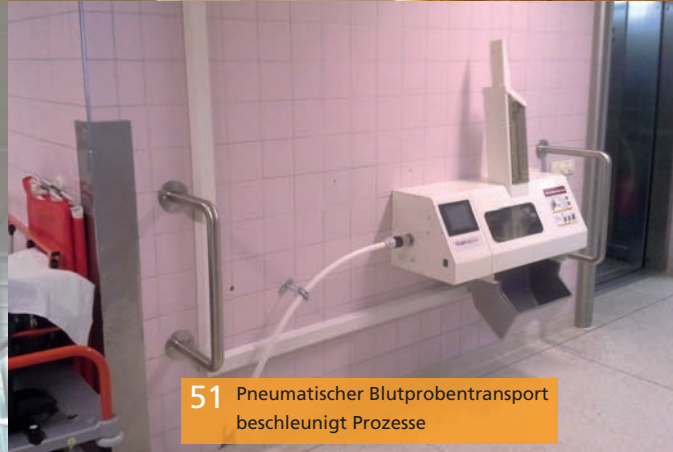
51 Pneumatischer Blutprobentransport beschleunigt Prozesse