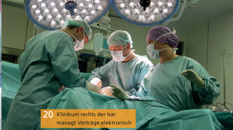
20 Klinikum rechts der Isar managt Verträge elektronisch