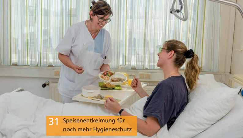
31 Speisenerkennung für noch mehr Hygieneschutz