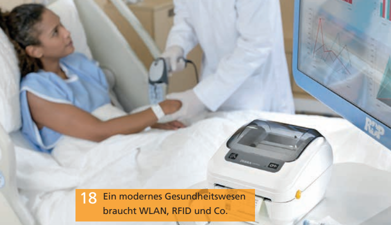
18 Ein modernes Gesundheitswesen braucht WLAN, RFID und Co.