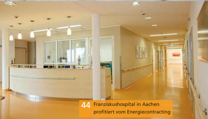
44 Franziskushospital in Aachen profitiert vom Energiecontracting