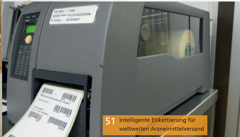
51 Intelligente Etikettierung für weltweiten Arzneimittelversand

Die Kostenschraube richtig zudrehen Über Beschaffung, Infrastruktur und Einzelmaßen Einsparungen bei Strom und Wärme erzielen