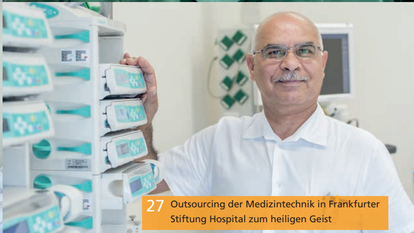
27 Outsourcing der Medizintechnik in Frankfurter Stiftung Hospital zum heiligen Geist