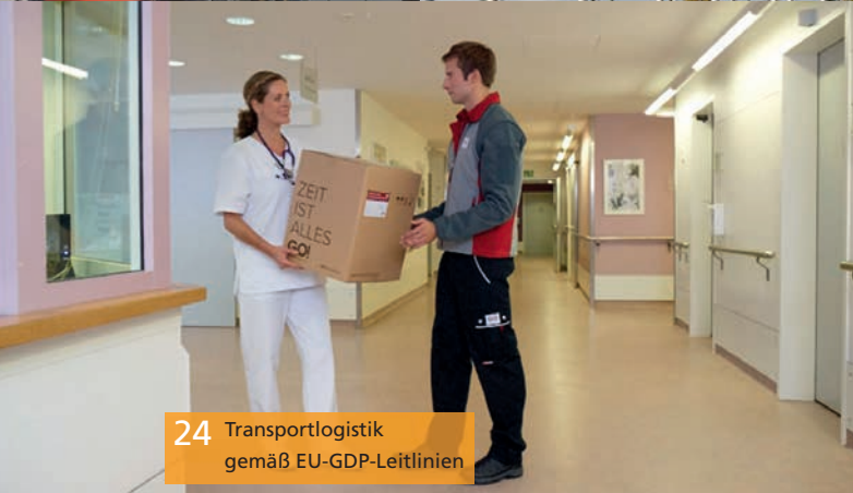
24 Transportlogistik gemäß EU-GDP-Leitlinien