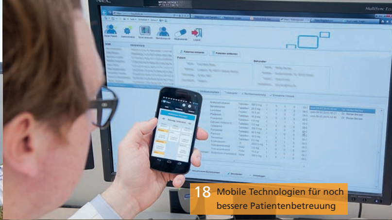
18 Mobile Technologien für noch bessere Patientenbetreuung