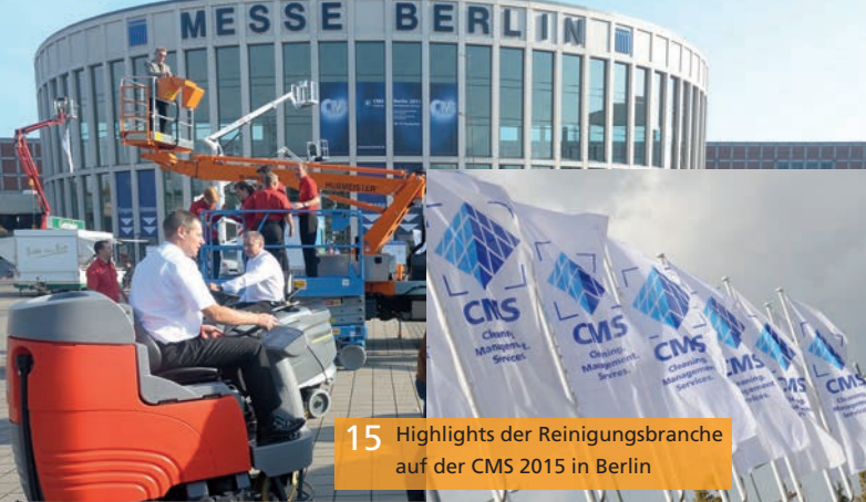
15 Highlights der Reinigungsbranche auf der CMS 2015 in Berlin