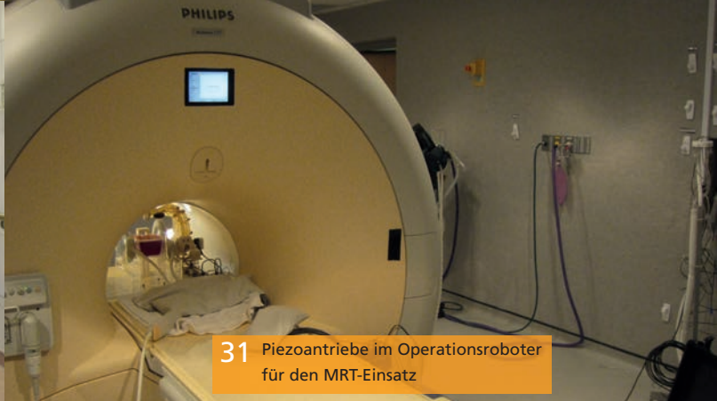
31 Piezoantriebe im Operationsroboter für den MRT-Einsatz