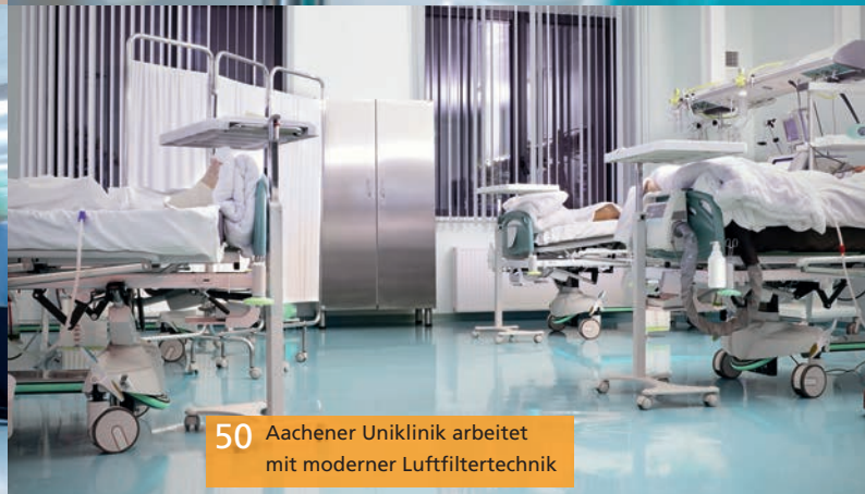
50 Aachener Uniklinik arbeitet mit moderner Luftfiltertechnik

Unterschätztes Problem Praktische Lösungsansätze im Kampf gegen Legionellen