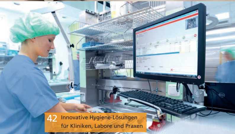
42 Innovative Hygiene-Lösungen für Kliniken, Labore und Praxen