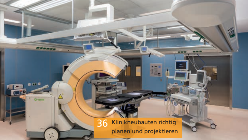
36 Klinikneubauten richtig planen und projektieren