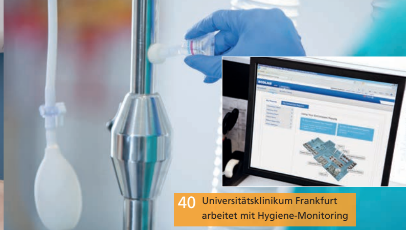
40 Universitätsklinikum Frankfurt arbeitet mit Hygiene-Monitoring