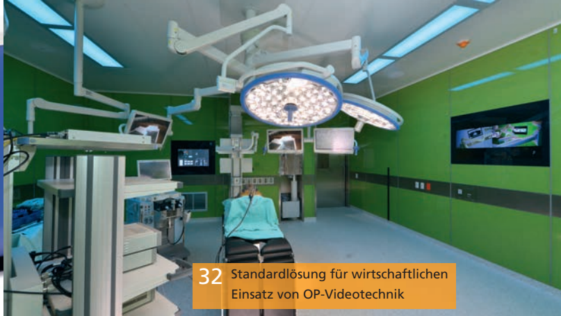
32 Standardlösung für wirtschaftlichen Einsatz von OP-Videotechnik