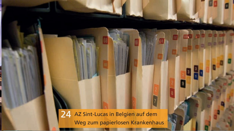
24 AZ Sint-Lucas in Belgien auf dem Weg zum papierlosen Krankenhaus