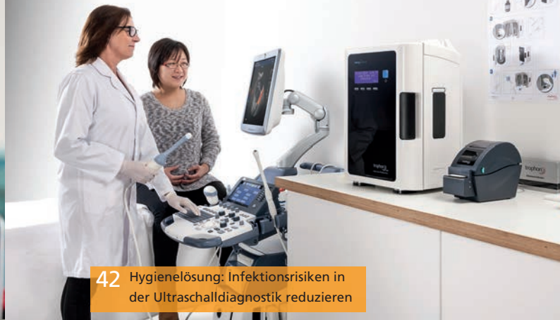
42 Hygienelösung: Infektionsrisiken in der Ultraschalldiagnostik reduzieren