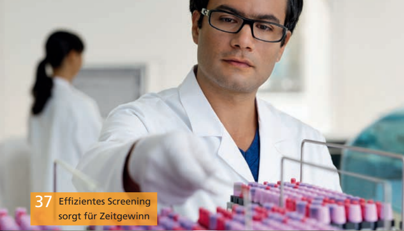
37 Effizientes Screening sorgt für Zeitgewinn