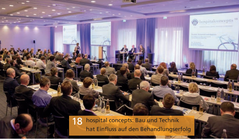
18 hospital concepts: Bau und Technik hat Einfluss auf den Behandlungserfolg