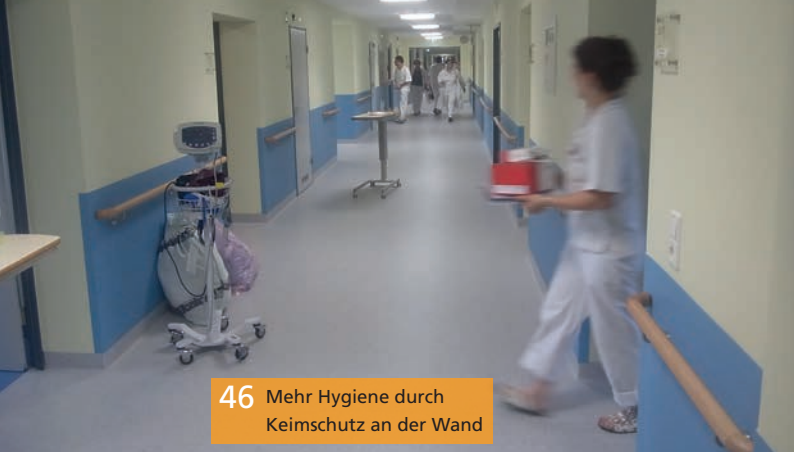
46 Mehr Hygiene durch Keimschutz an der Wand