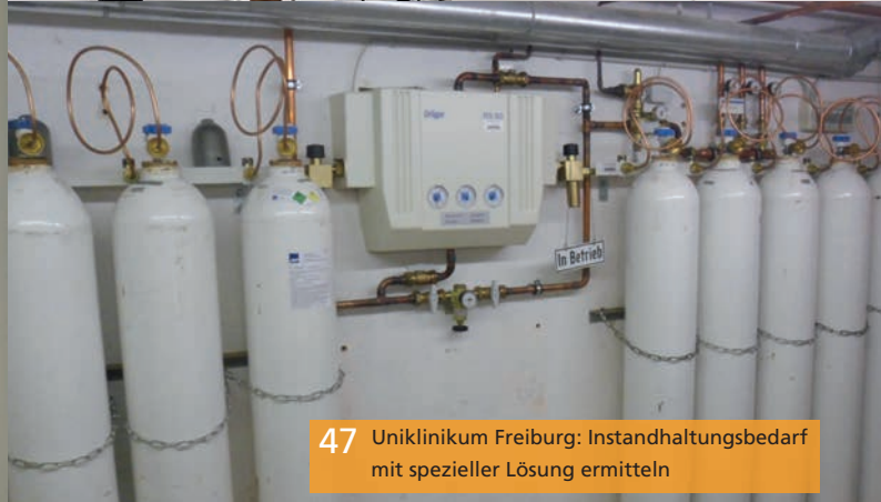
47 Uniklinikum Freiburg: Instandhaltungsbedarf mit spezieller Lösung ermitteln