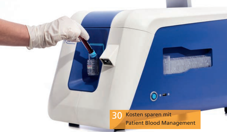
30 Kosten sparen mit Patient Blood Management