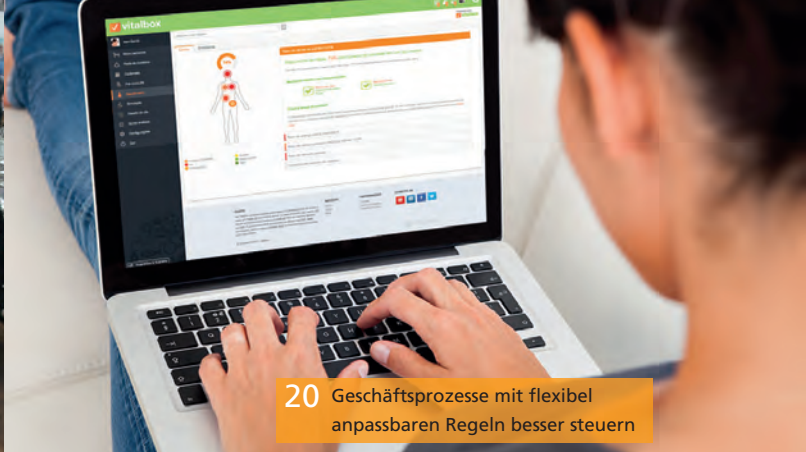
20 Geschäftsprozesse mit flexibel anpassbaren Regeln besser steuern