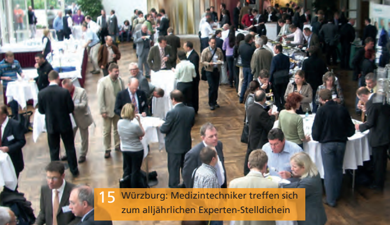
15 Würzburg: Medizintechniker treffen sich zum alljährlichen Experten-Stelldichein