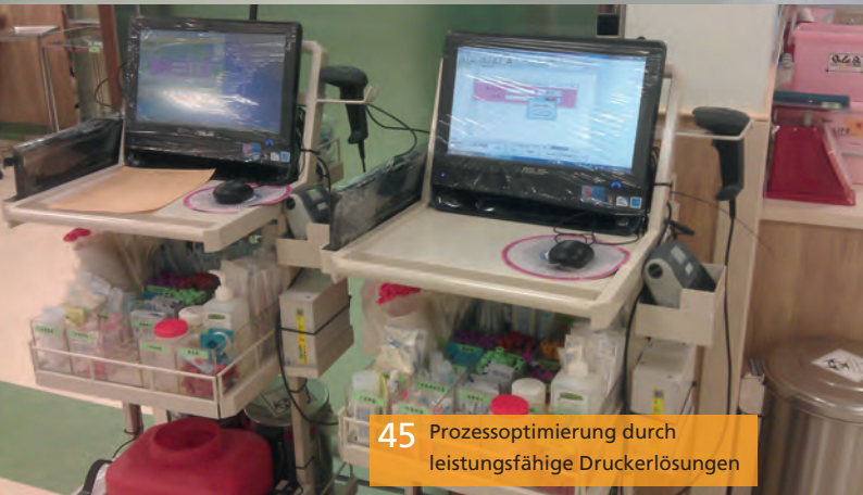
45 Prozessoptimierung durch leistungsfähige Druckerlösungen