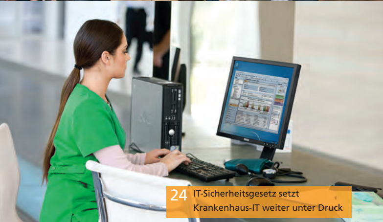
24 IT-Sicherheitsgesetz setzt Krankenhaus-IT weiter unter Druck