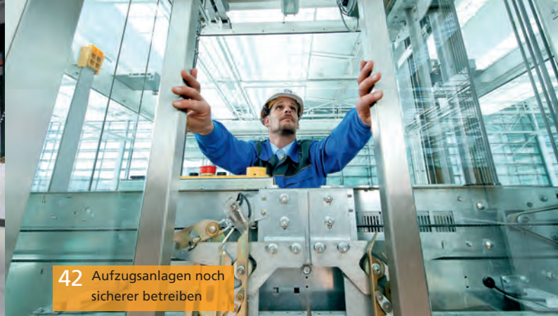
42 Aufzugsanlagen noch sicherer betreiben