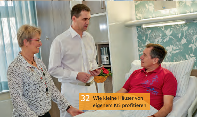
32 Wie kleine Häuser von eigenem KIS profitieren