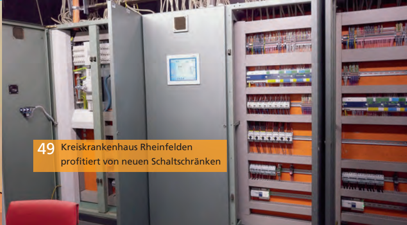
49 Kreiskrankenhaus Rheinfelden profitiert von neuen Schaltschränken