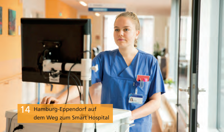
14 Hamburg-Eppendorf auf dem Weg zum Smart Hospital