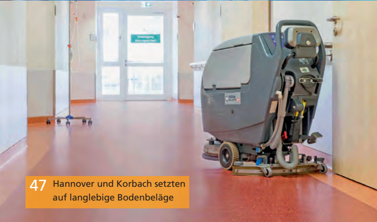
47 Hannover und Korbach setzen auf langlebige Bodenbeläge