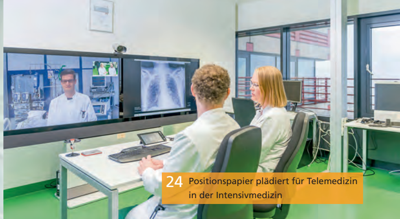
24 Positionspapier plädiert für Telemedizin in der Intensivmedizin