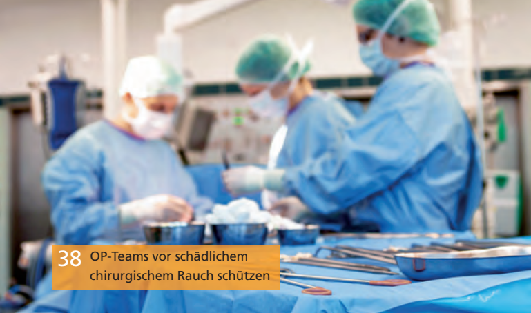
38 OP-Teams vor schädlichem chirurgischem Rauch schützen