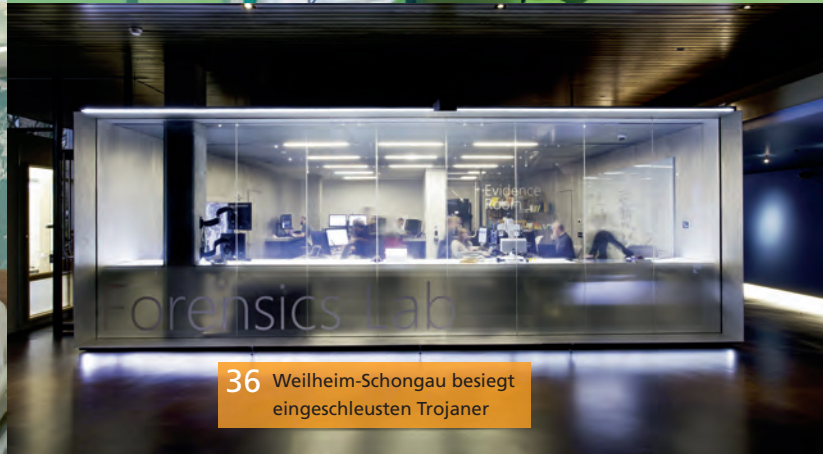
36 Weilheim-Schongau besiegt eingeschleusten Trojaner