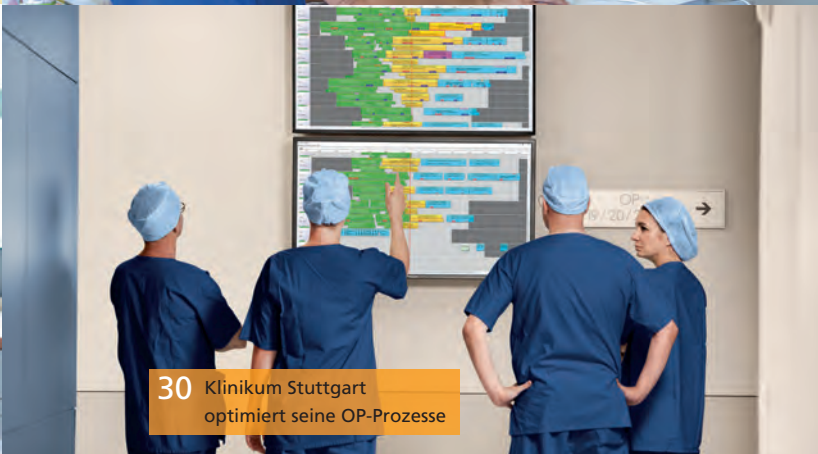
30 Klinikum Stuttgart optimiert seine OP-Prozesse