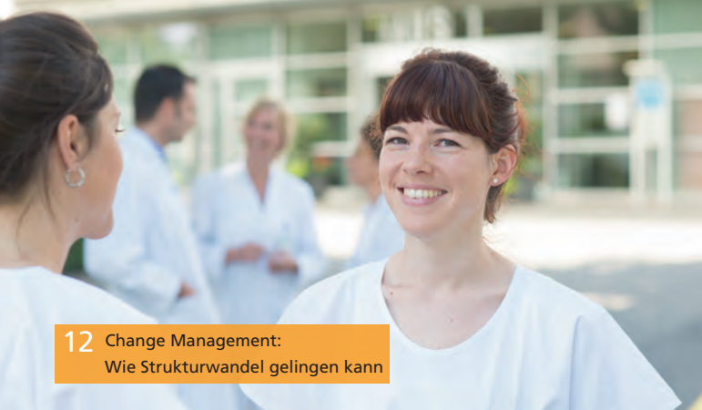
12 Change Management: Wie Strukturwandel gelingen kann