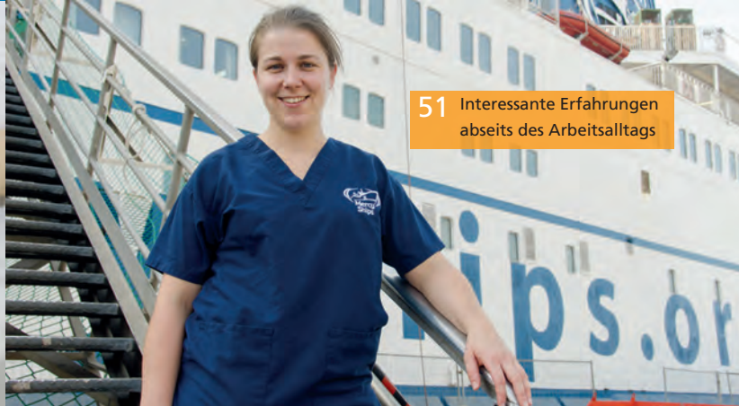
51 Interessante Erfahrungen abseits des Arbeitsalltags