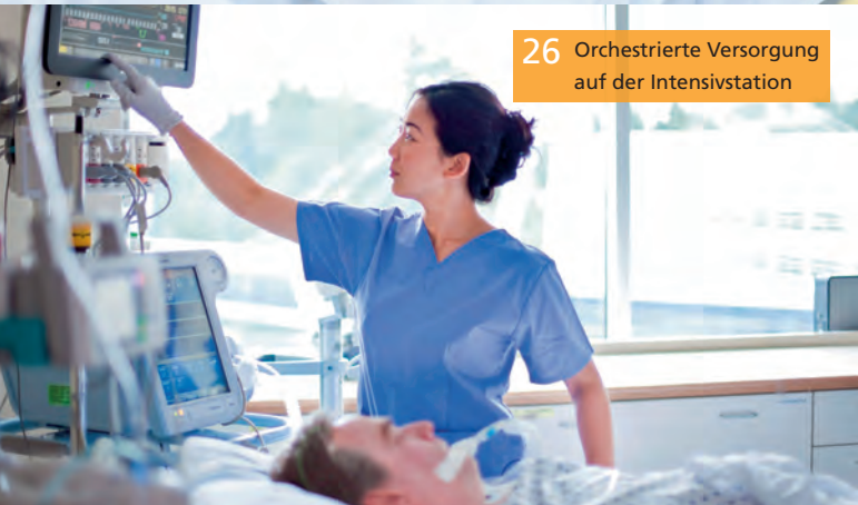
26 Orchestrierte Versorgung auf der Intensivstation