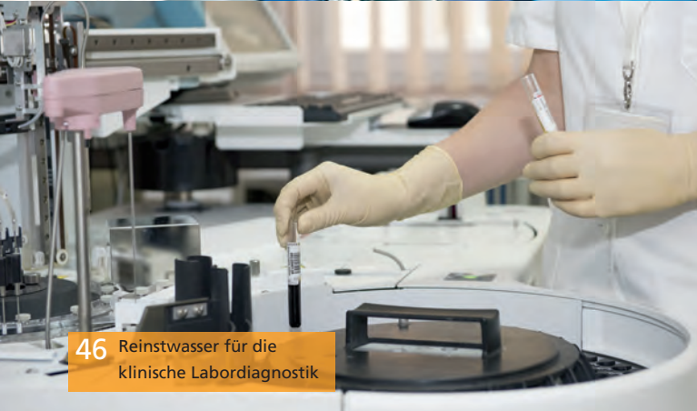
46 Reinstwasser für die klinische Labordiagnostik