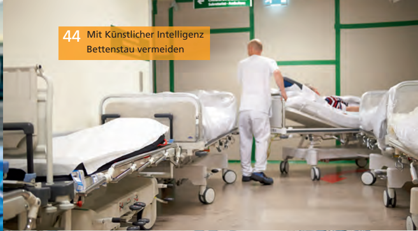
44 Mit Künstlicher Intelligenz Bettenstau vermeiden