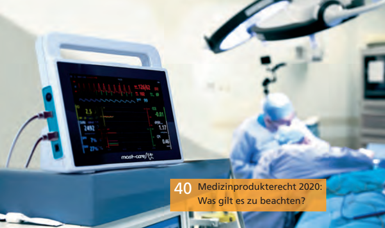
40 Medizinprodukterecht 2020: Was gilt es zu beachten?