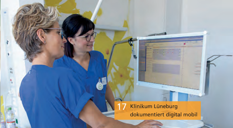
17 Klinikum Lüneburg dokumentiert digital mobil