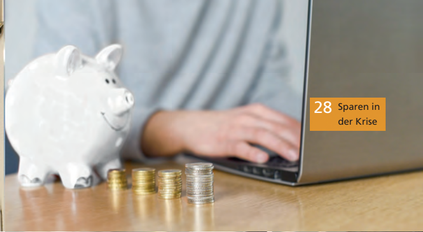
28 Sparen in der Krise