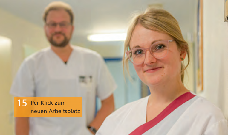
15 Per Klick zum neuen Arbeitsplatz