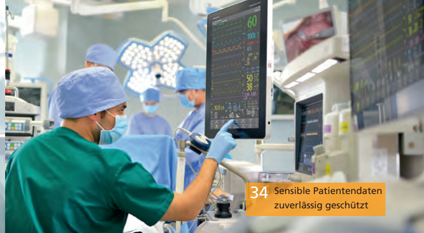
34 Sensible Patientendaten zuverlässig geschützt