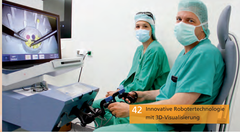
42 Innovative Robotertechnologie mit 3D-Visualisierung