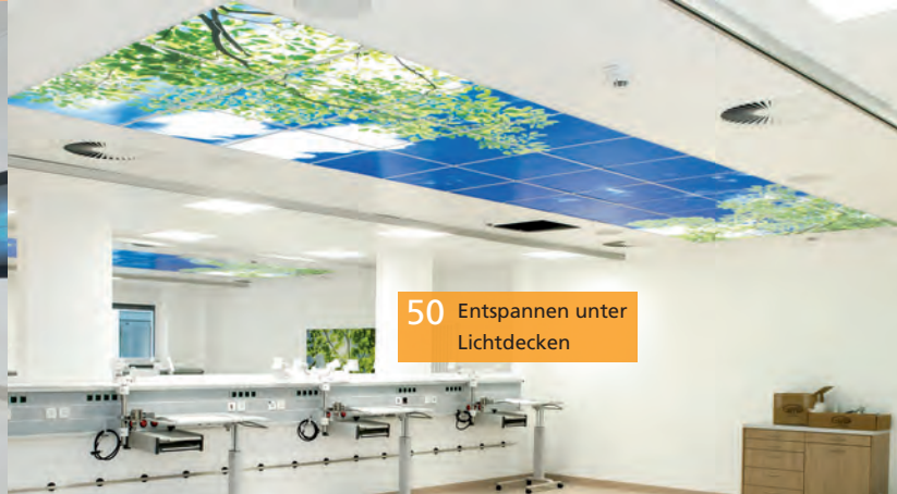
50 Entspannen unter Lichtdecken