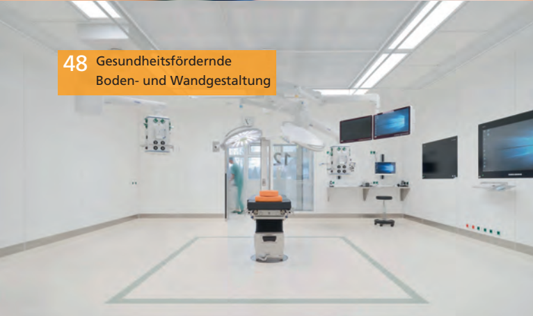
48 Gesundheitsfördernde Boden- und Wandgestaltung