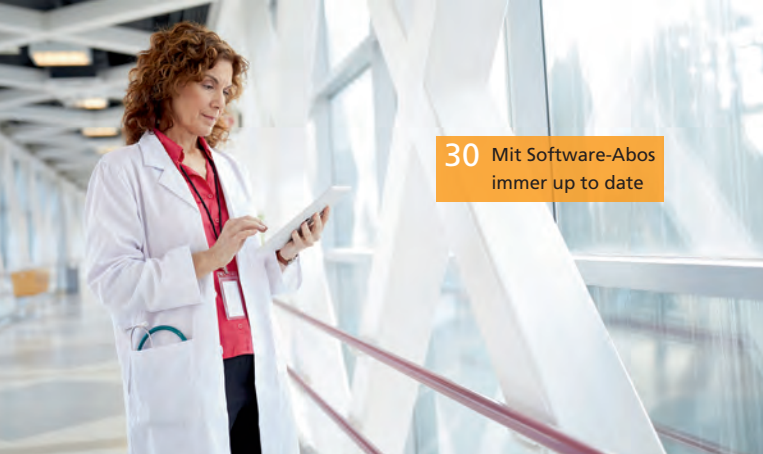
30 Mit Software-Abos immer up to date