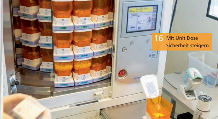
16 Mit Unit Dose Sicherheit steigern