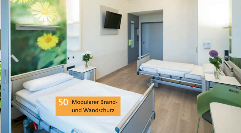
50 Modularer Brand- und Wandschutz