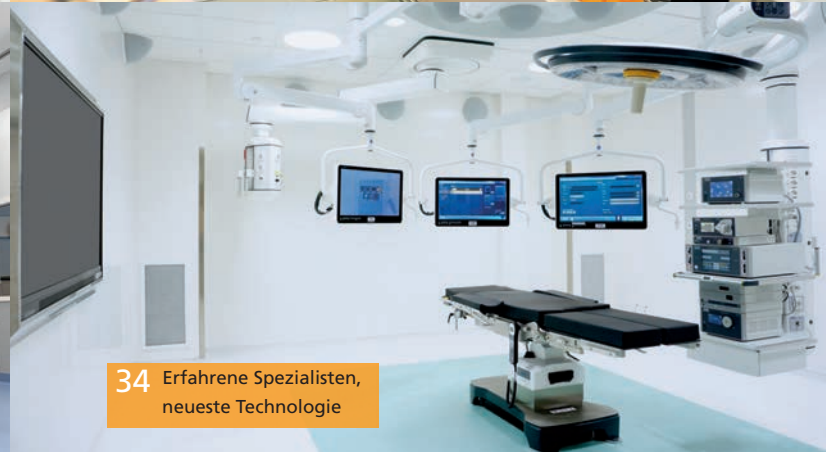
34 Erfahrene Spezialisten, neueste Technologie