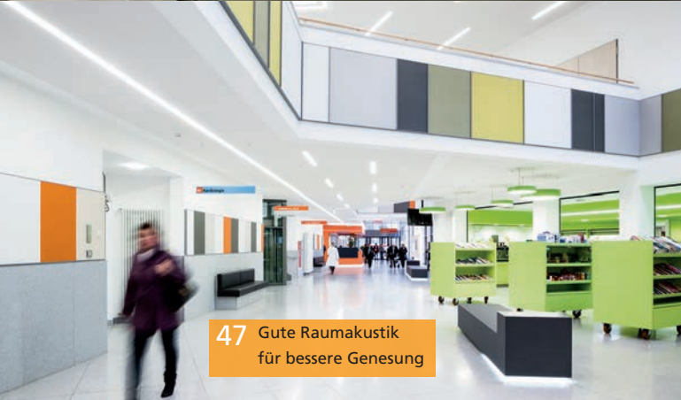
47 Gute Raumakustik für bessere Genesung