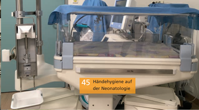
45 Händehygiene auf der Neonatologie