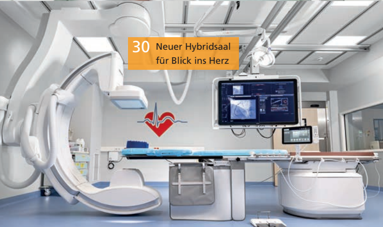
30 Neuer Hybridsaal für Blick ins Herz