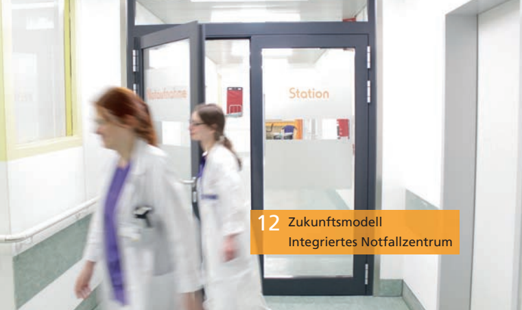
12 Zukunftsmodell Integriertes Notfallzentrum