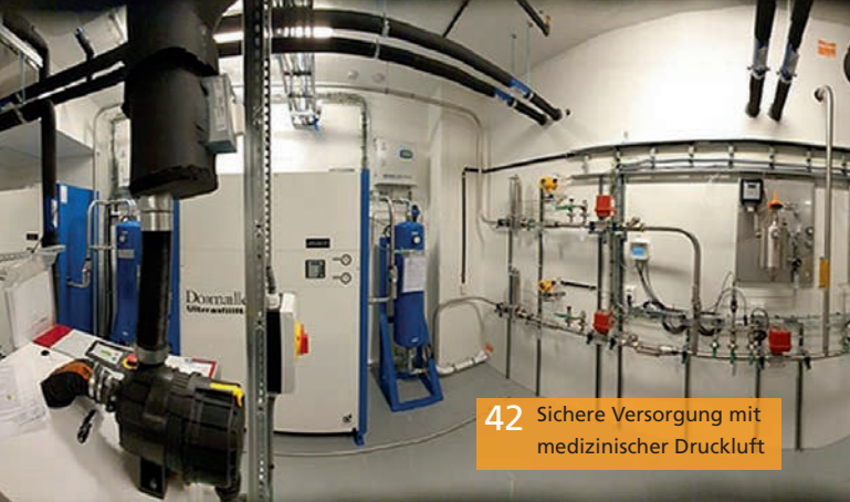
42 Sichere Versorgung mit medizinischer Druckluft