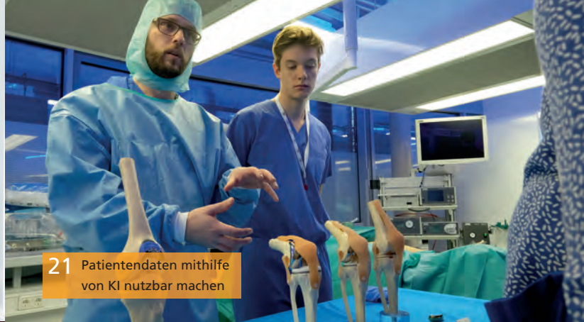
21 Patientendaten mithilfe von KI nutzbar machen