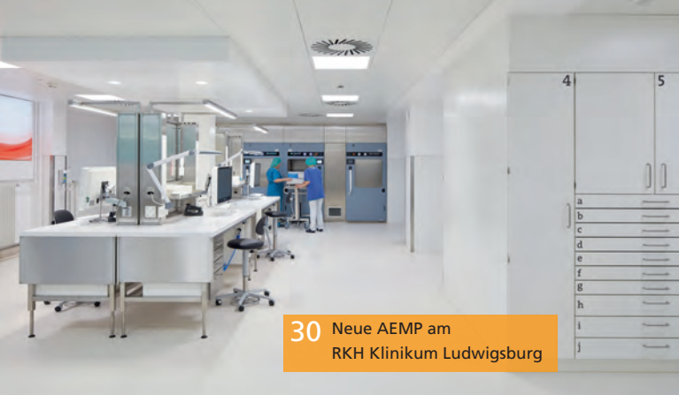
30 Neue AEMP am RKH Klinikum Ludwigsburg