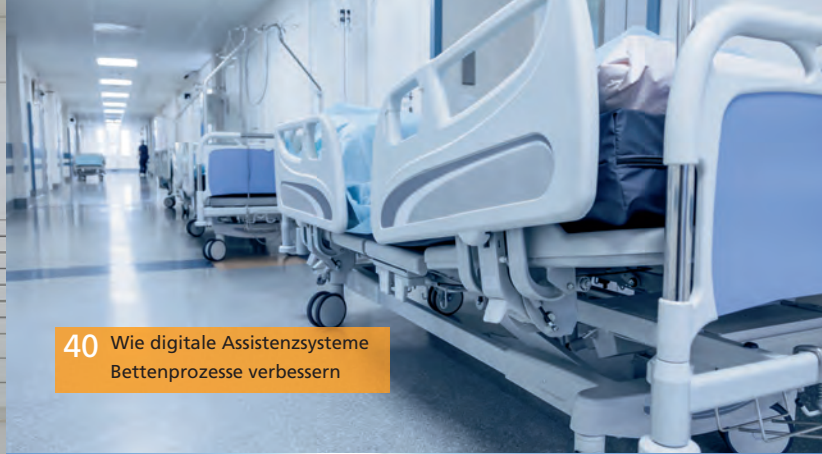
40 Wie digitale Assistenzsysteme Bettenprozesse verbessern