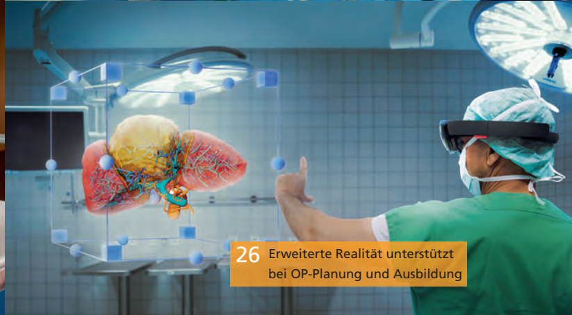
26 Erweiterte Realität unterstützt bei OP-Planung und Ausbildung