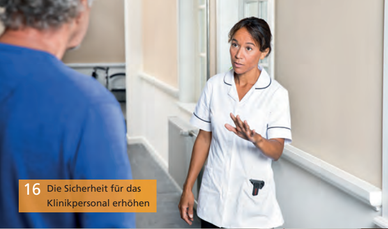
16 Die Sicherheit für das Klinikpersonal erhöhen