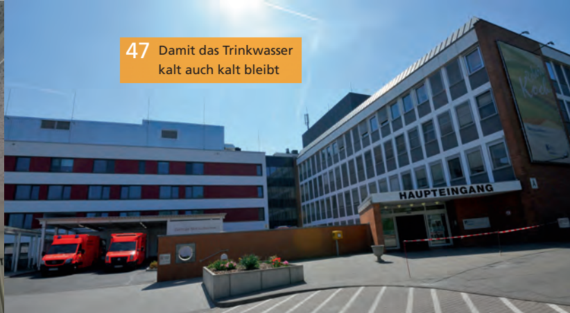
47 Damit das Trinkwasser kalt auch kalt bleibt