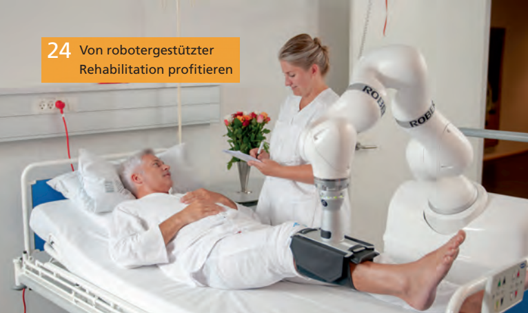
24 Von robotergestützter Rehabilitation profitieren