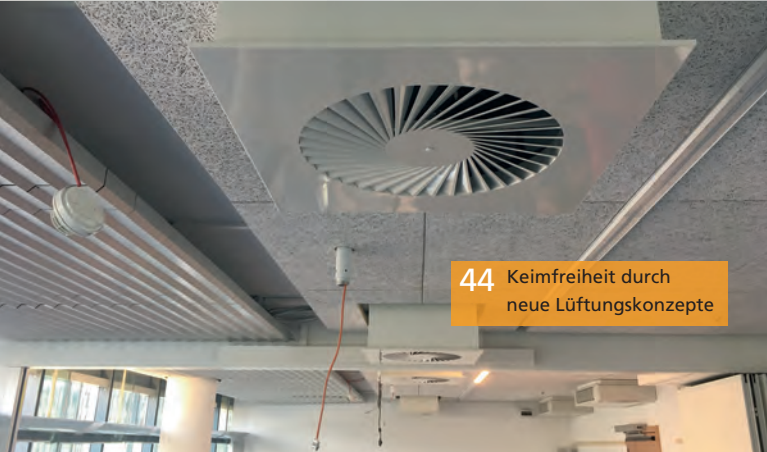
44 Keimfreiheit durch neue Lüftungskonzepte