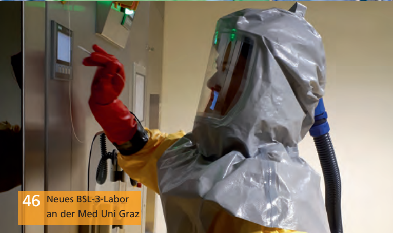
46 Neues BSL-3-Labor an der Med Uni Graz