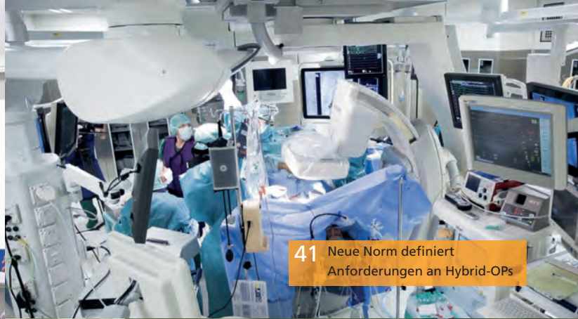
41 Neue Norm definiert Anforderungen an Hybrid-OPs