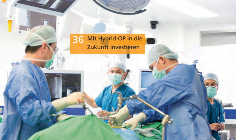
36 Mit Hybrid-OP in die Zukunft investieren