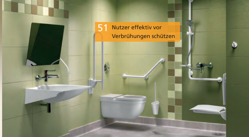
51 Nutzer effektiv vor Verbrühungen schützen