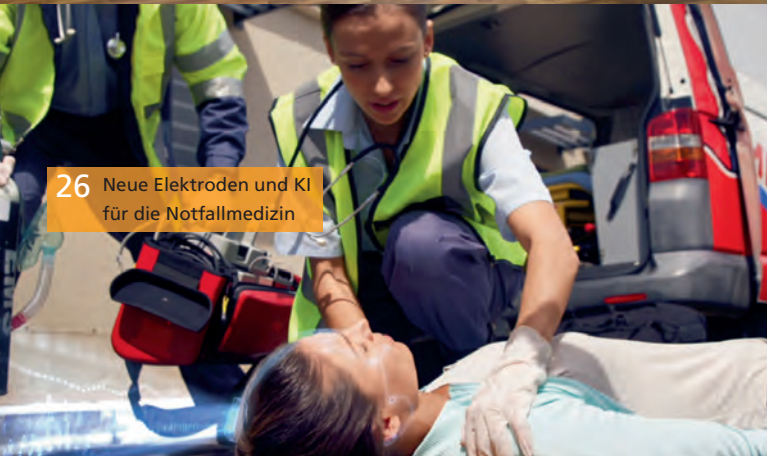
26 Neue Elektroden und KI für die Notfallmedizin