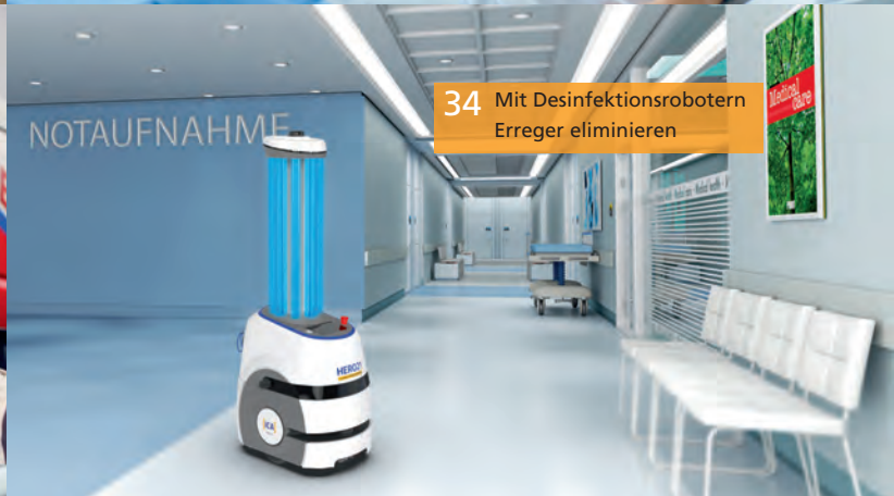
34 Mit Desinfektionsrobotern Erreger eliminieren