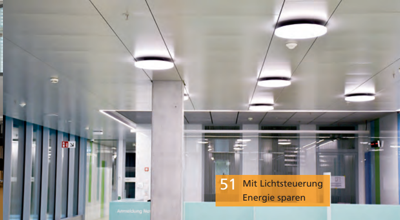
51 Mit Lichtsteuerung Energie sparen