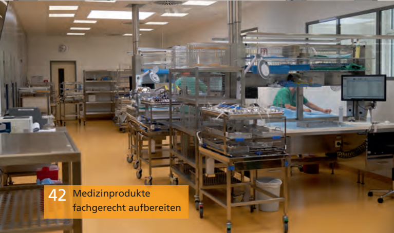
42 Medizinprodukte fachgerecht aufbereiten