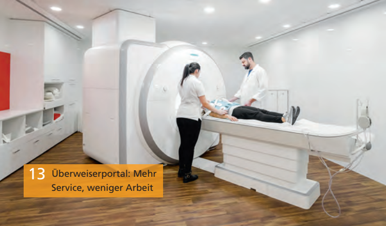
13 Überweiserportal: Mehr Service, weniger Arbeit