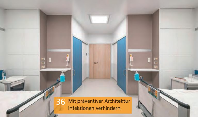
36 Mit präventiver Architektur Infektionen verhindern