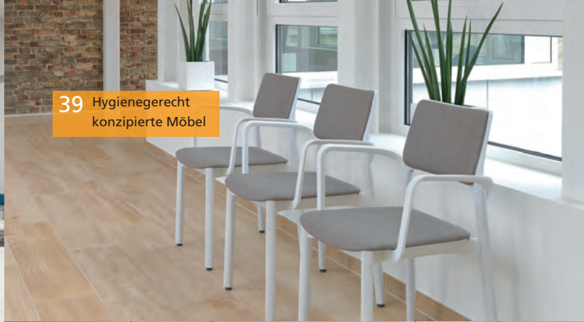
39 Hygienegerecht konzipierte Möbel