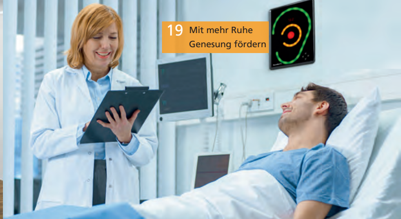
19 Mit mehr Ruhe Genesung fördern