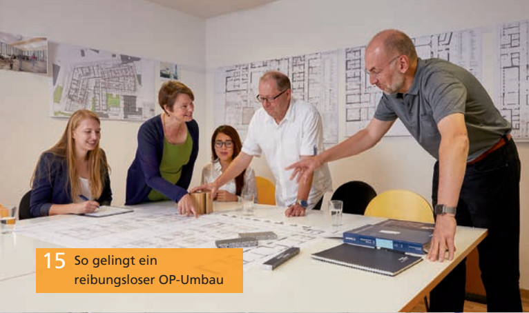
15 So gelingt ein reibungsloser OP-Umbau