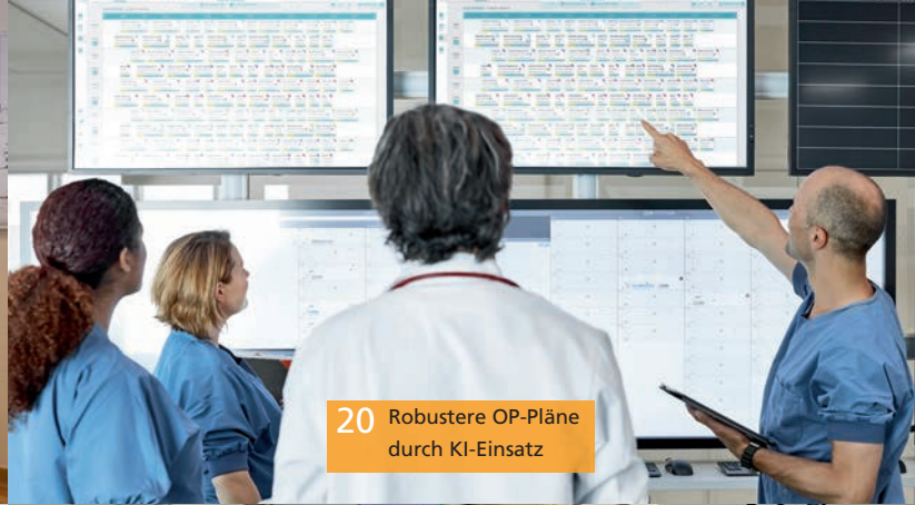
20 Robustere OP-Pläne durch KI-Einsatz