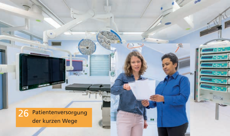
26 Patientenversorgung der kurzen Wege