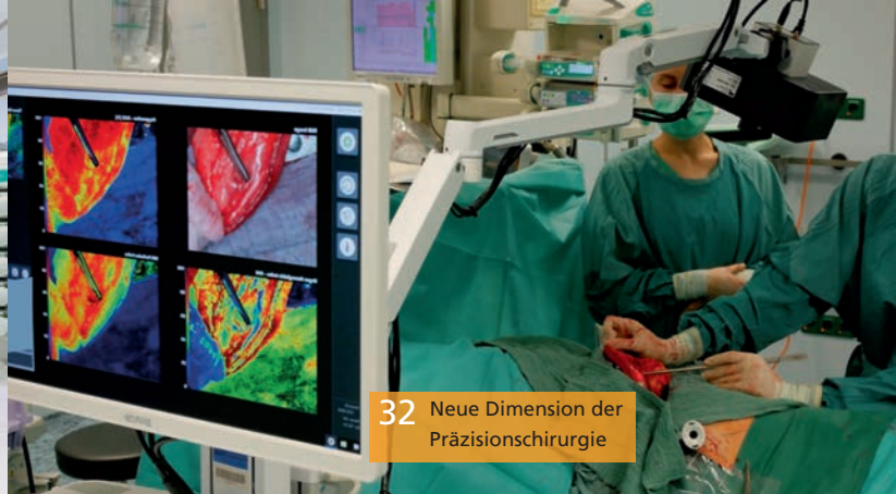
32 Neue Dimension der Präzisionschirurgie