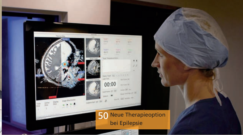
50 Neue Therapieoption bei Epilepsie