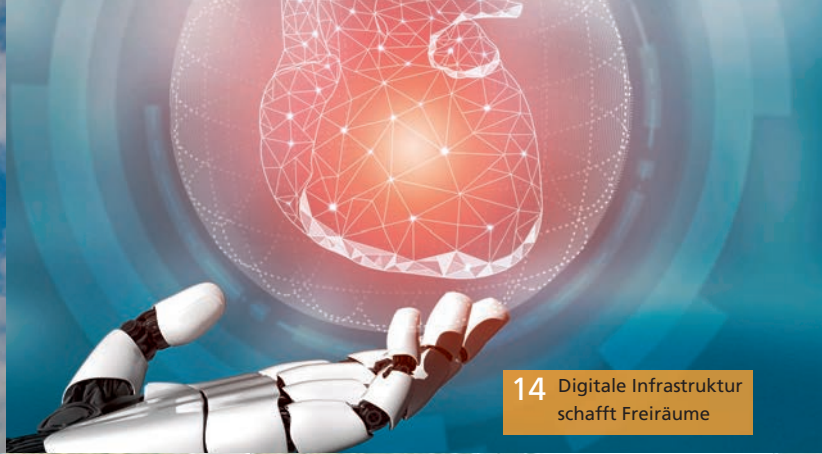
14 Digitale Infrastruktur schafft Freiräume