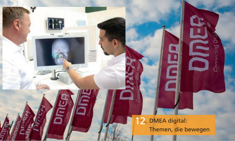
12 DMEA digital: Themen, die bewegen