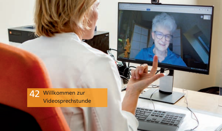
42 Willkommen zur Videosprechstunde