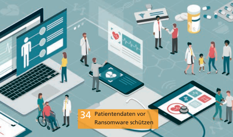
34 Patientendaten vor Ransomware schützen