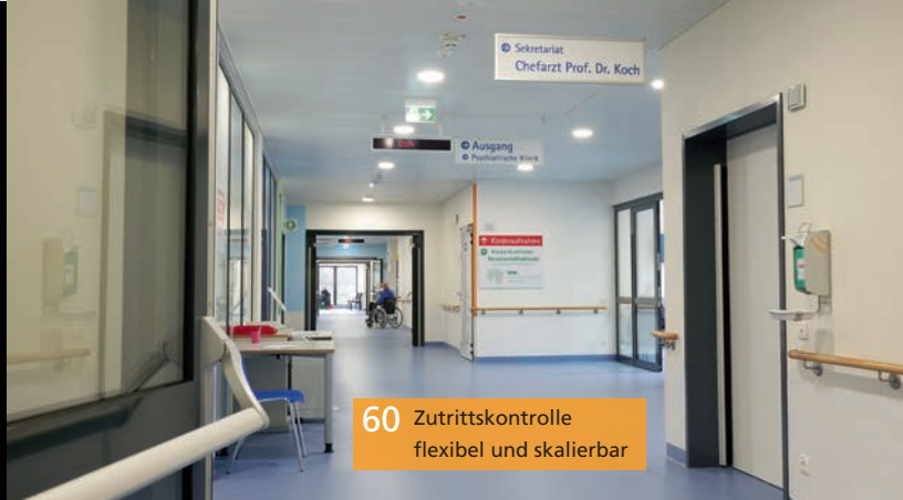
60 Zutrittskontrolle flexibel und skalierbar