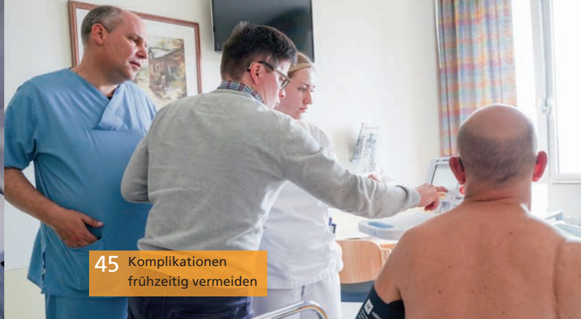
45 Komplikationen frühzeitig vermeiden