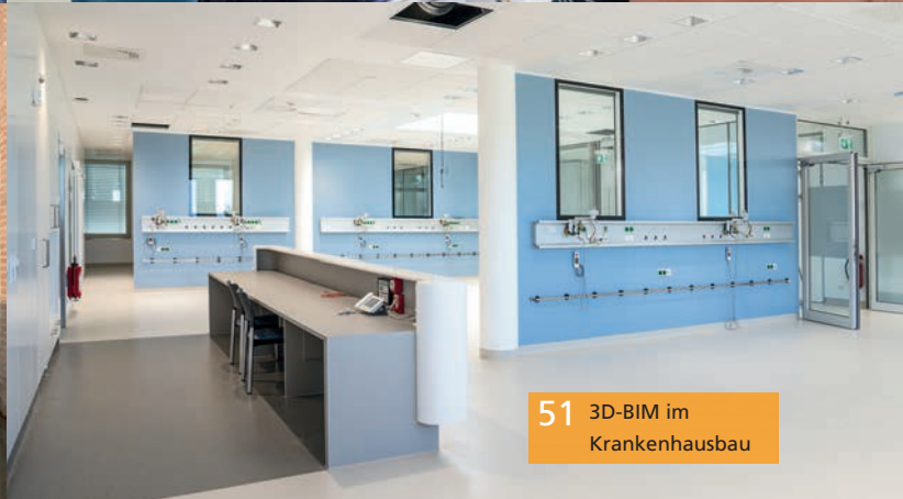
51 3D-BIM im Krankenhausbau