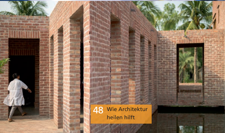
48 Wie Architektur heilen hilft