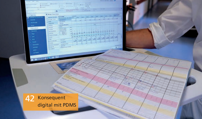
42 Konsequenz digital mit PDMS