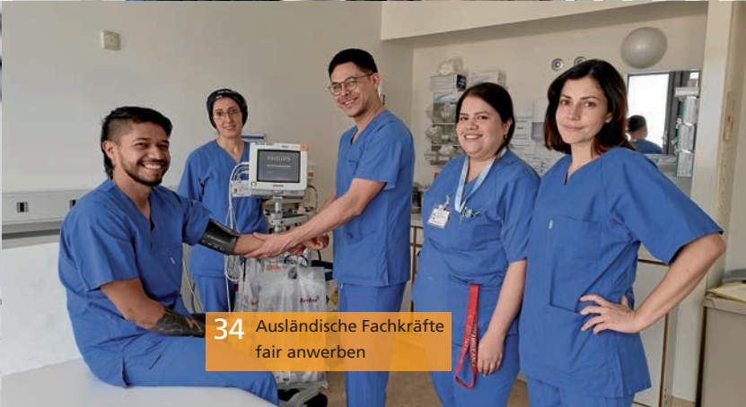
34 Ausländische Fachkräfte fair anwerben