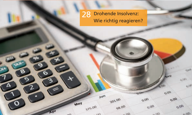
28 Drohende Insolvenz: Wie richtig reagieren?