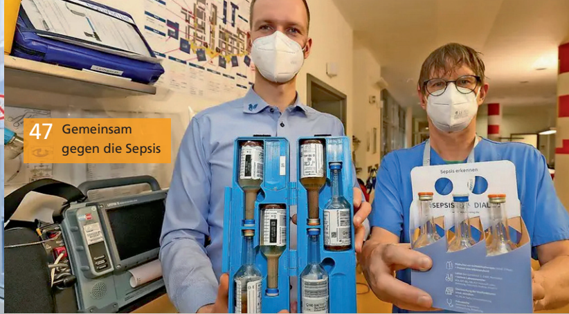
47 Gemeinsam gegen die Sepsis