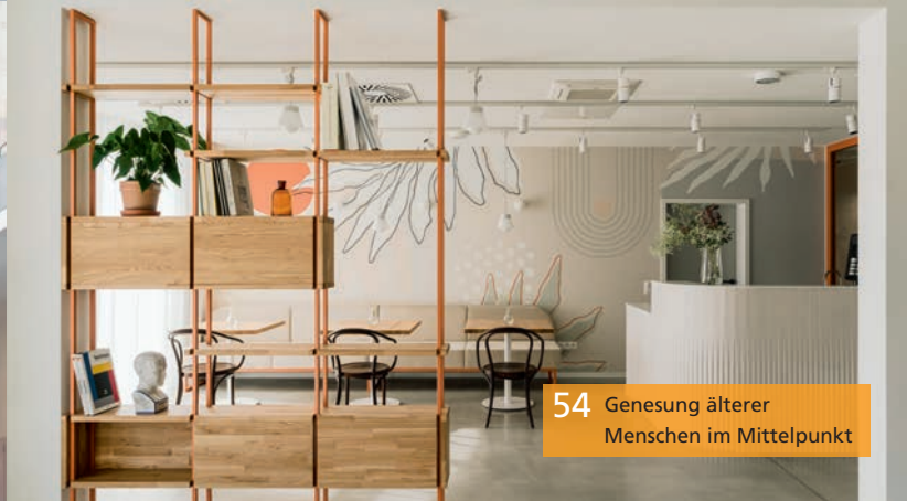
54 Genesung älterer Menschen im Mittelpunkt