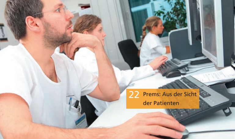
22 Premis: Aus der Sicht der Patienten