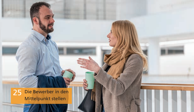
25 Die Bewerber in den Mittelpunkt stellen