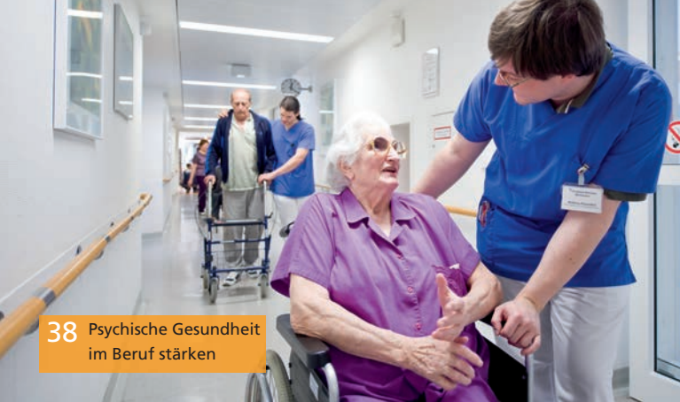
38 Psychische Gesundheit im Beruf stärken