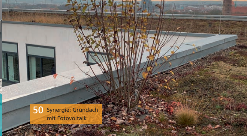
50 Synergie: Gründach mit Fotovoltaik