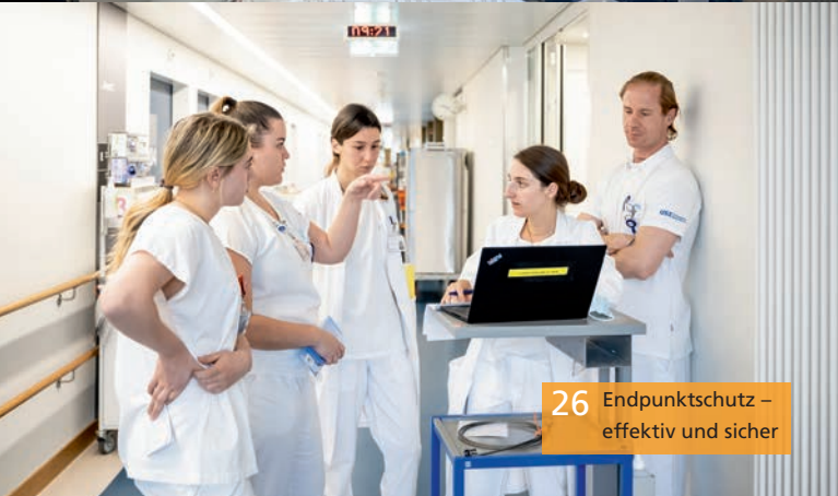
26 Endpunktschutz – effektiv und sicher