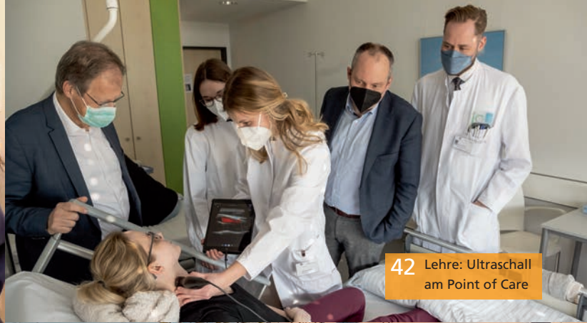
42 Lehre: Ultraschall am Point of Care