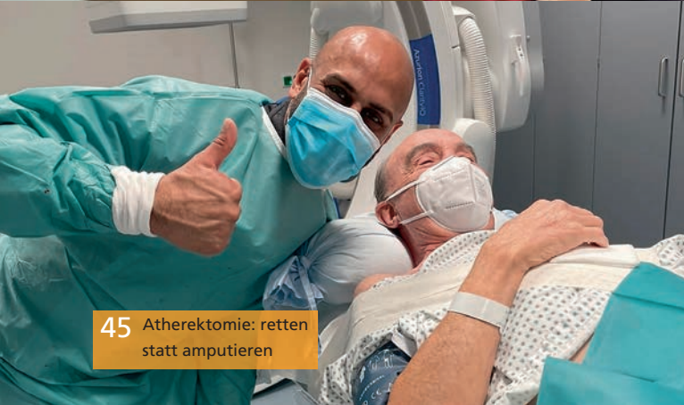
45 Atherektomie: retten statt amputieren