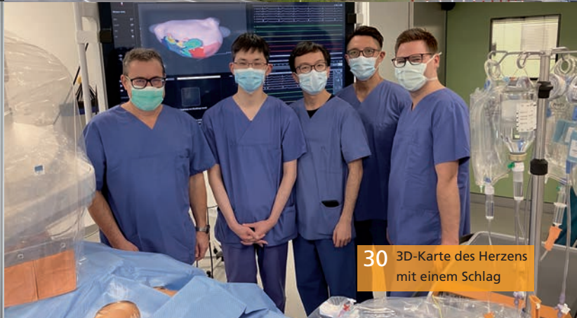
30 3D-Karte des Herzens mit einem Schlag