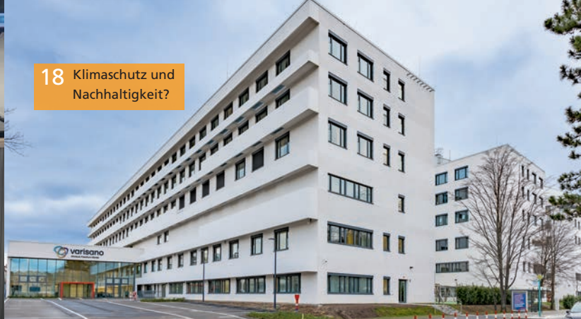
18 Klimaschutz und Nachhaltigkeit?