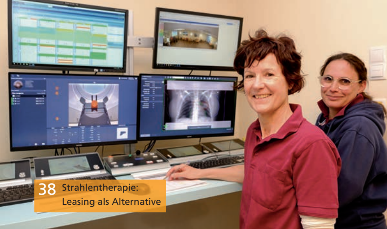
38 Strahlentherapie: Leasing als Alternative