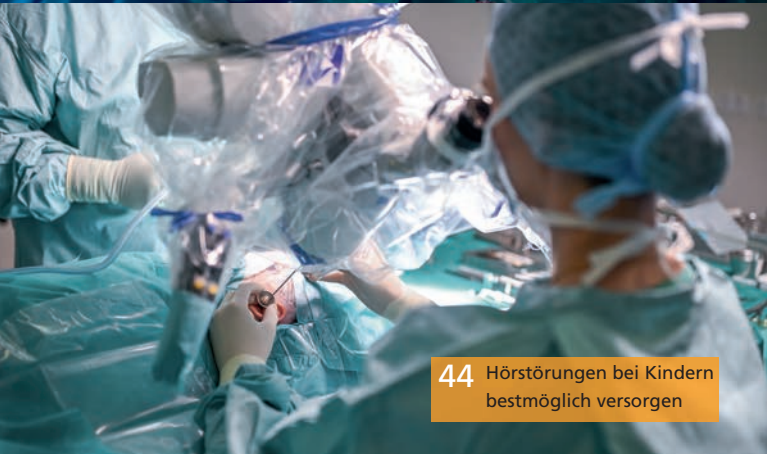
44 Hörstörungen bei Kindern bestmöglich versorgen