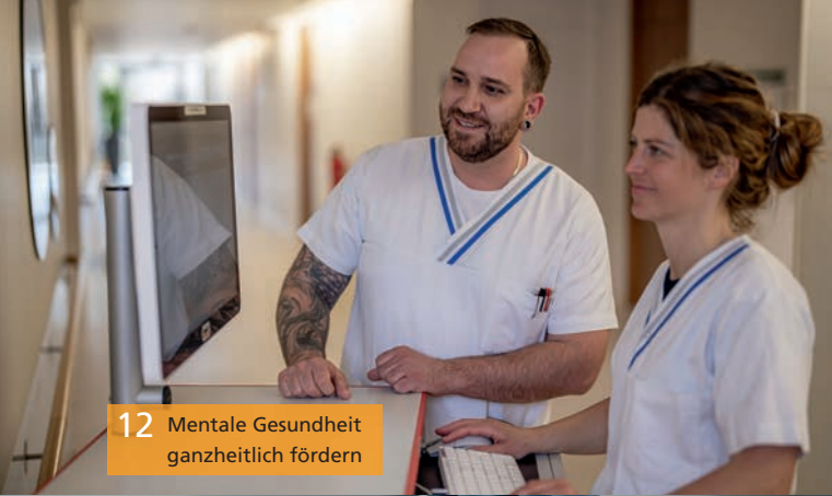
12 Mentale Gesundheit ganzheitlich fördern