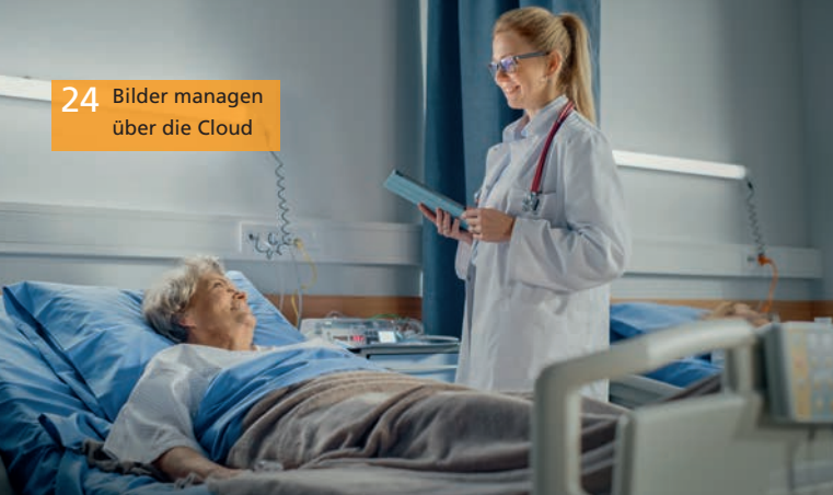
24 Bilder managen über die Cloud