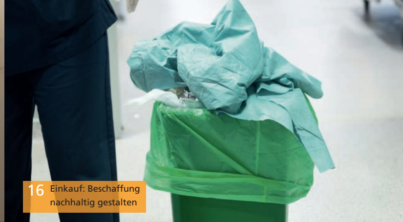
16 Einkauf: Beschaffung nachhaltig gestalten