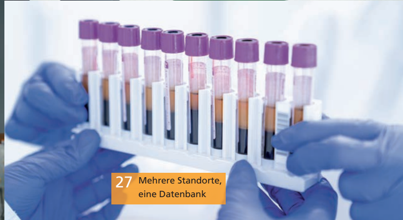
27 Mehrere Standorte, eine Datenbank