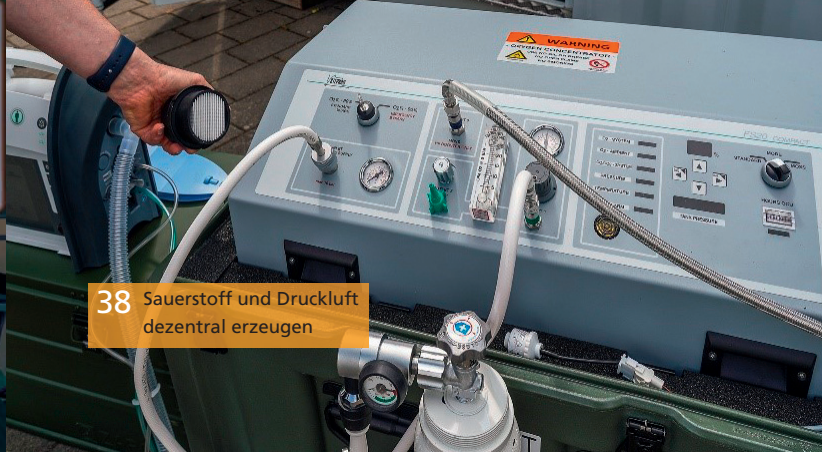
38 Sauerstoff und Druckluft dezentral erzeugen