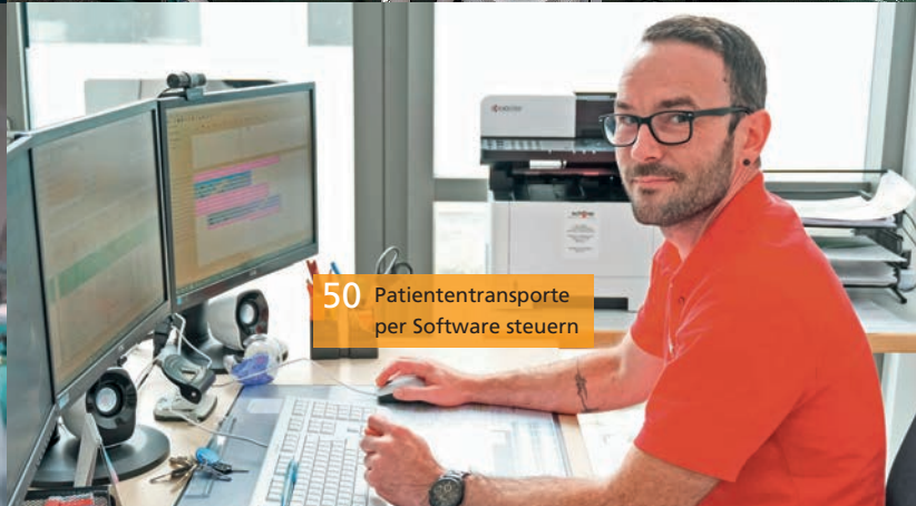
50 Patiententransporte per Software steuern