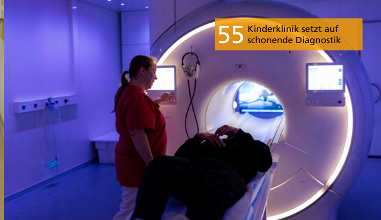
55 Kinderklinik setzt auf schonende Diagnostik