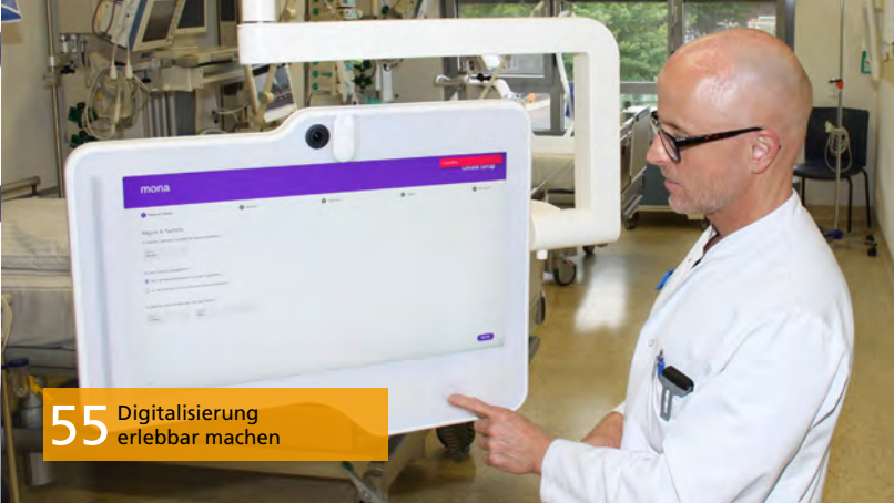
55 Digitalisierung erlebbar machen