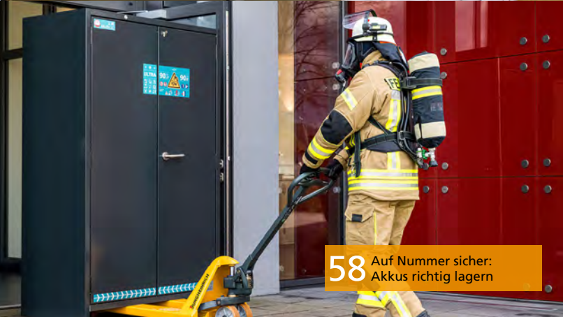
58 Auf Nummer sicher: Akkus richtig lagern