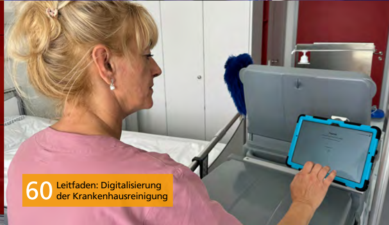
60 Leitfaden: Digitalisierung der Krankenhausreinigung