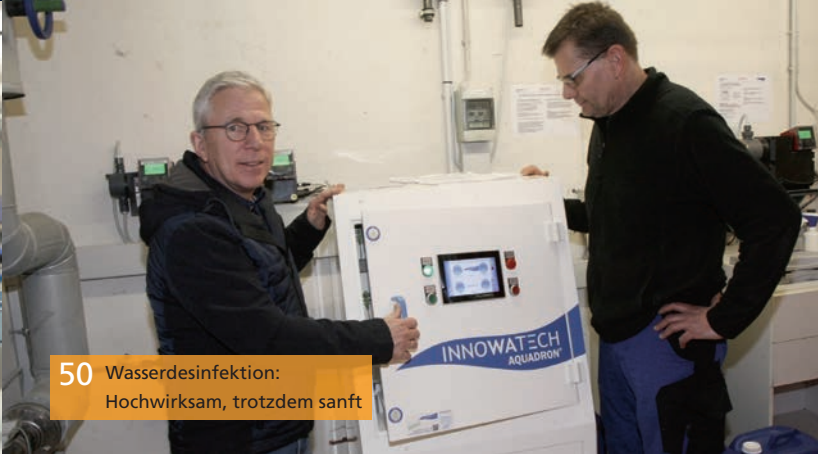
50 Wasserdiesinfektion: Hochwirksam, trotzdem sanft