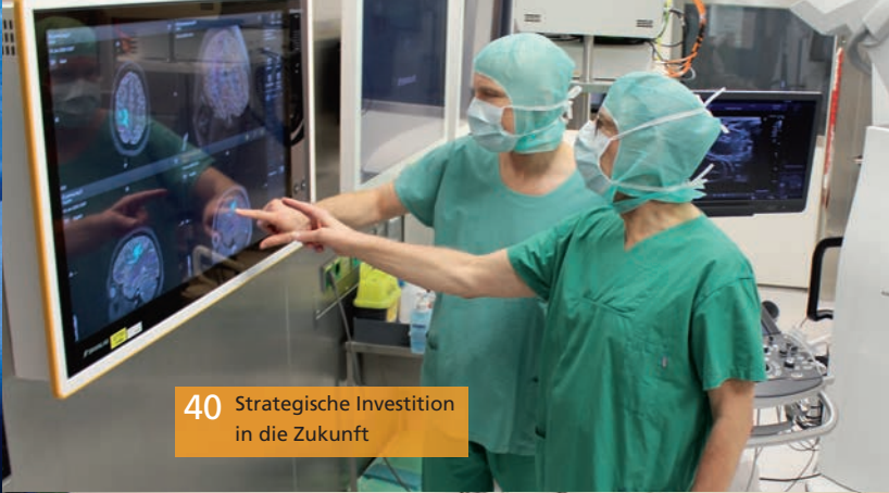
40 Strategische Investition in die Zukunft