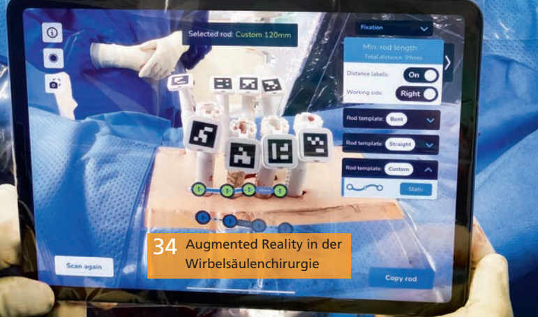
34 Augmented Reality in der Wirbelsäulen Chirurgie