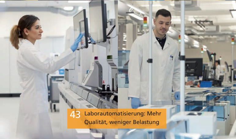
43 Laborautomatisierung: Mehr Qualität, weniger Belastung