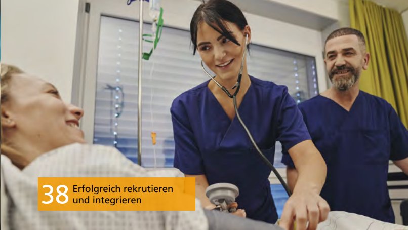
38 Erfolgreich rekrutieren und integrieren