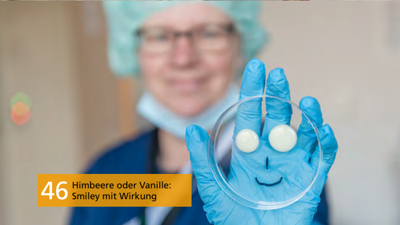
46 Himbeere oder Vanille: Smiley mit Wirkung