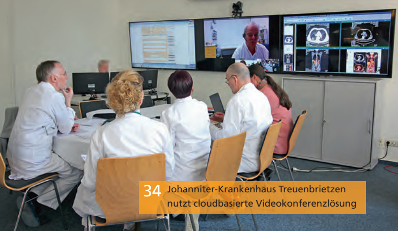
34 Johanniter-Krankenhaus Treuenbrietzen nutzt cloudbasierte Videokonferenzlösung