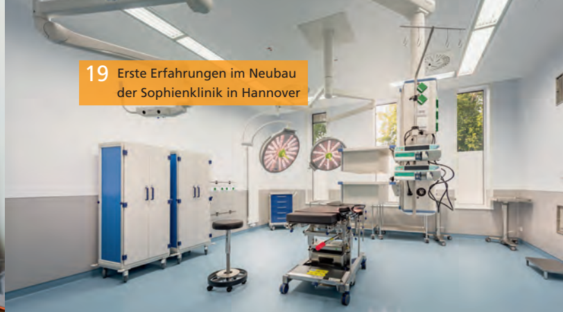
19 Erste Erfahrungen im Neubau der Sophienklinik in Hannover