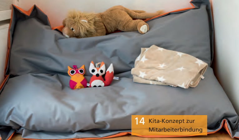
14 Kita-Konzept zur Mitarbeiterbindung