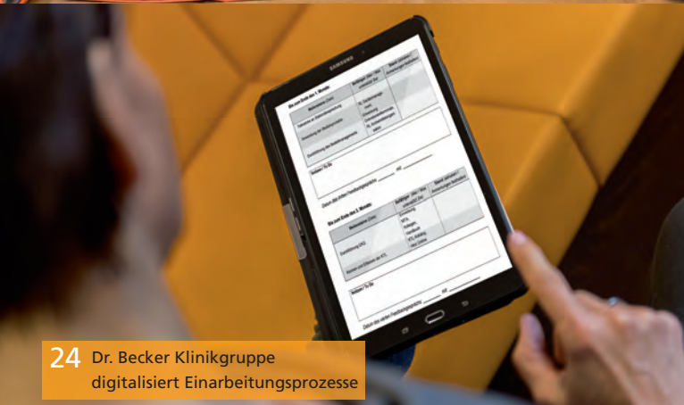
24 Dr. Becker Klinikgruppe digitalisiert Einarbeitungsprozesse