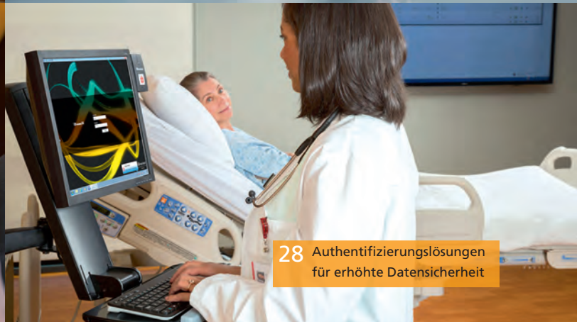
28 Authentifizierungslösungen für erhöhte Datensicherheit