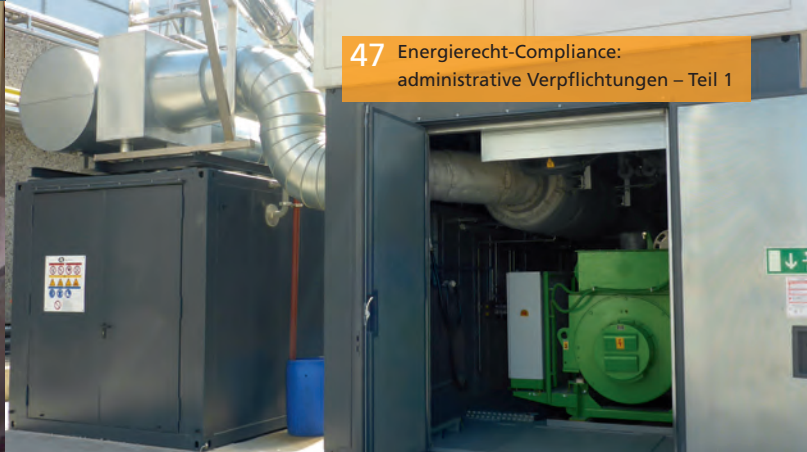
47 Energierecht-Compliance: administrative Verpflichtungen – Teil 1