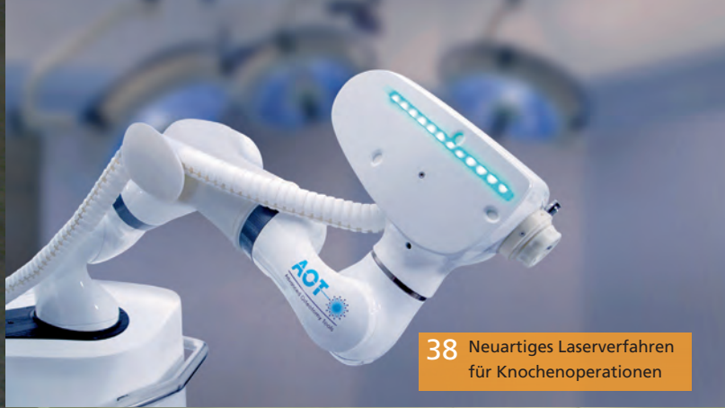
38 Neuartiges Laserverfahren für Knochenoperationen