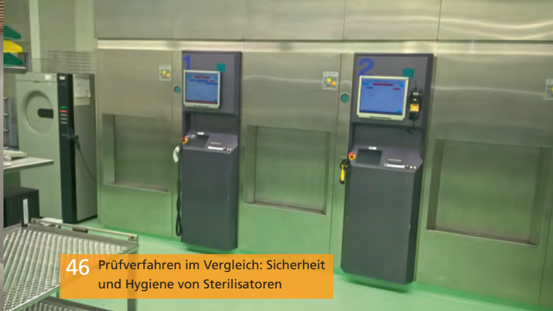
46 Prüfverfahren im Vergleich: Sicherheit und Hygiene von Sterilisatoren