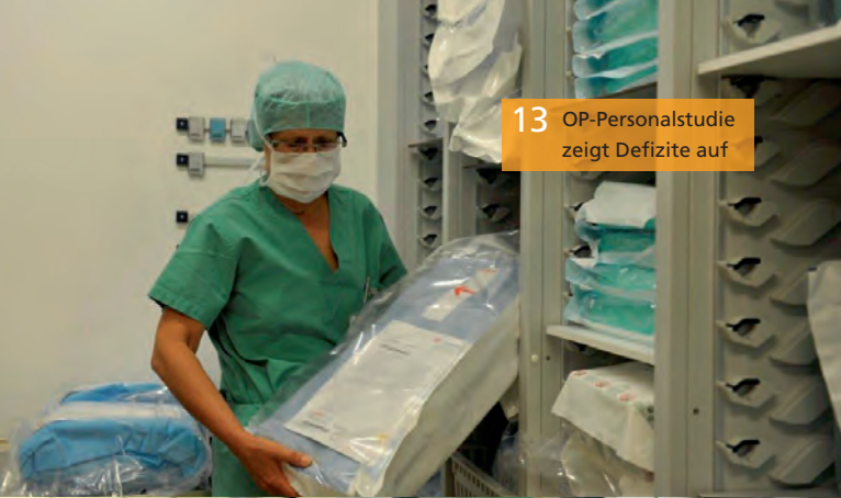
13 OP-Personalstudie zeigt Defizite auf