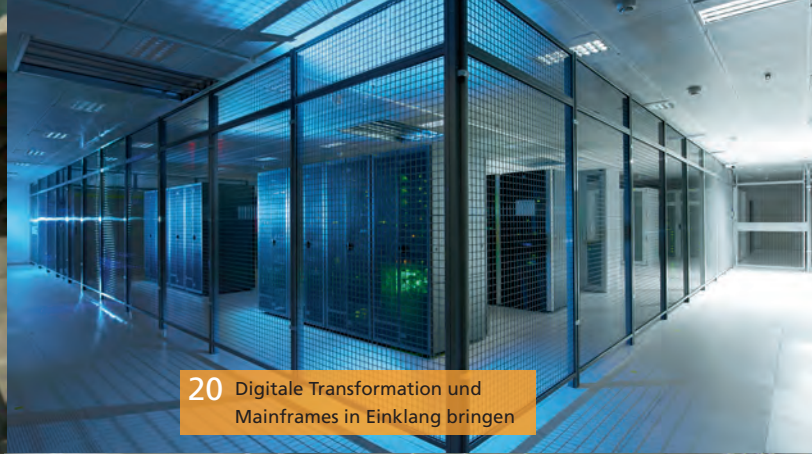
20 Digitale Transformation und Mainframes in Einklang bringen