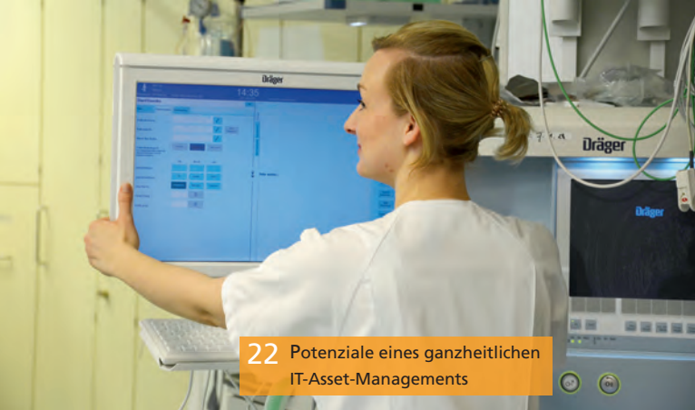
22 Potenziale eines ganzheitlichen IT-Asset-Managements