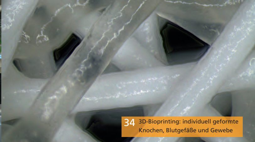
34 3D-Bioprinting: individuell geformte Knochen, Blutgefäße und Gewebe