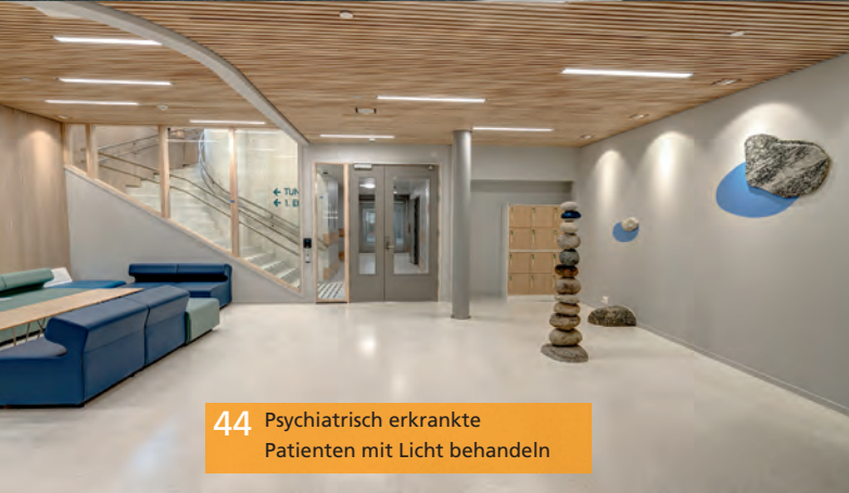
44 Psychiatrisch erkrankte Patienten mit Licht behandeln