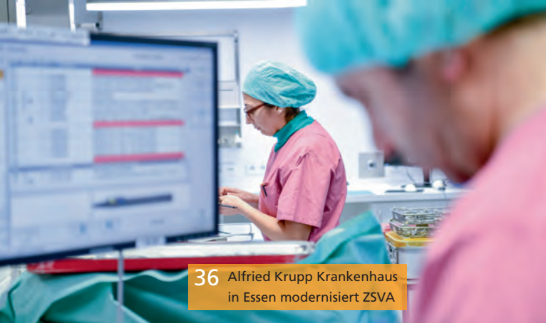
36 Alfried Krupp Krankenhaus in Essen modernisiert ZSVA