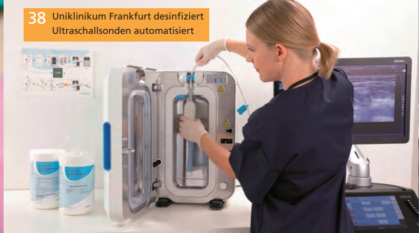
38 Uniklinikum Frankfurt desinfiziert Ultraschallsonden automatisiert