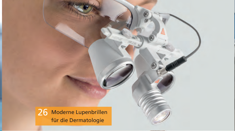
26 Moderne Lupenbrillen für die Dermatologie