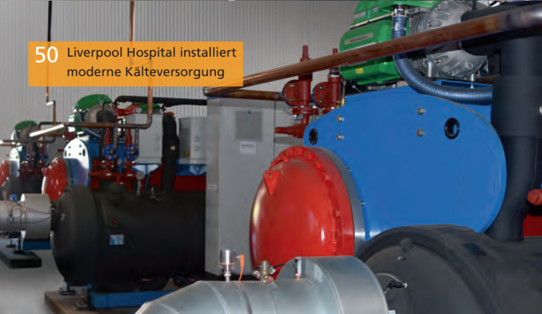
50 Liverpool Hospital installiert moderne Kälteversorgung