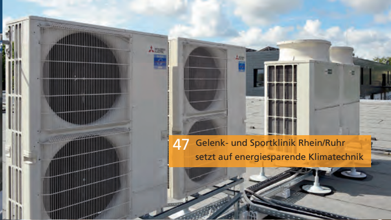
47 Gelenk- und Sportklinik Rhein/Ruhr setzt auf energiesparende Klimatechnik