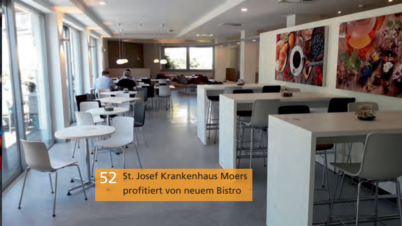
52 St. Josef Krankenhaus Moers profitiert von neuem Bistro