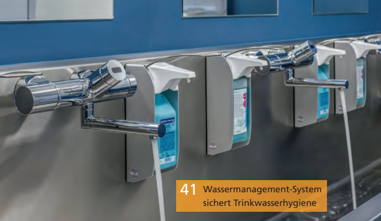
41 Wassermanagement-System sichert Trinkwasserhygiene