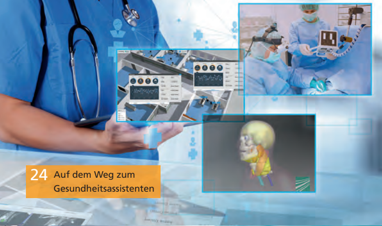
24 Auf dem Weg zum Gesundheitsassistenten