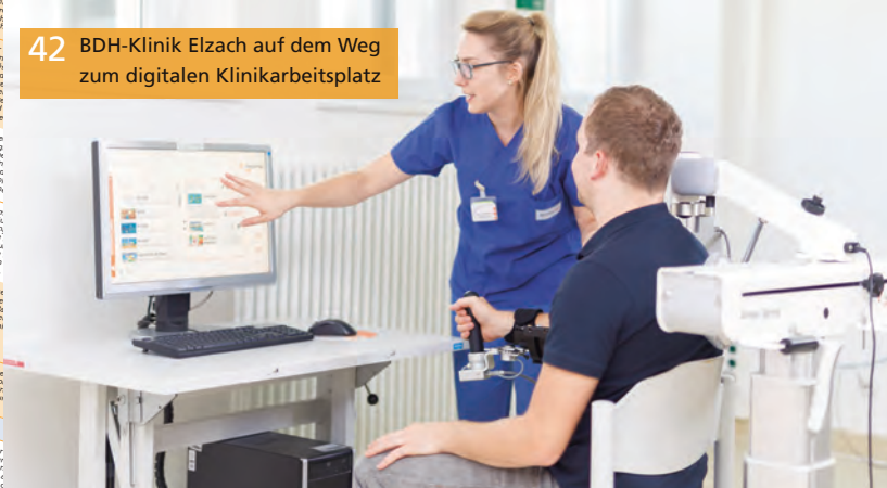
42 BDH-Klinik Elzach auf dem Weg zum digitalen Klinikarbeitsplatz