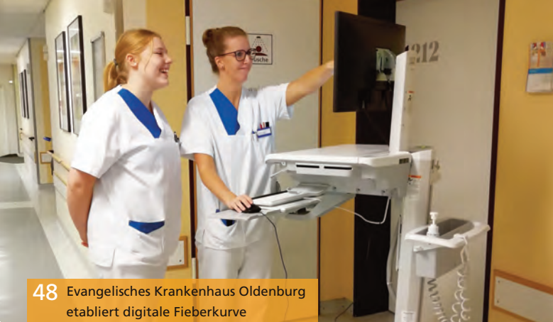
48 Evangelisches Krankenhaus Oldenburg etabliert digitale Fieberkurve