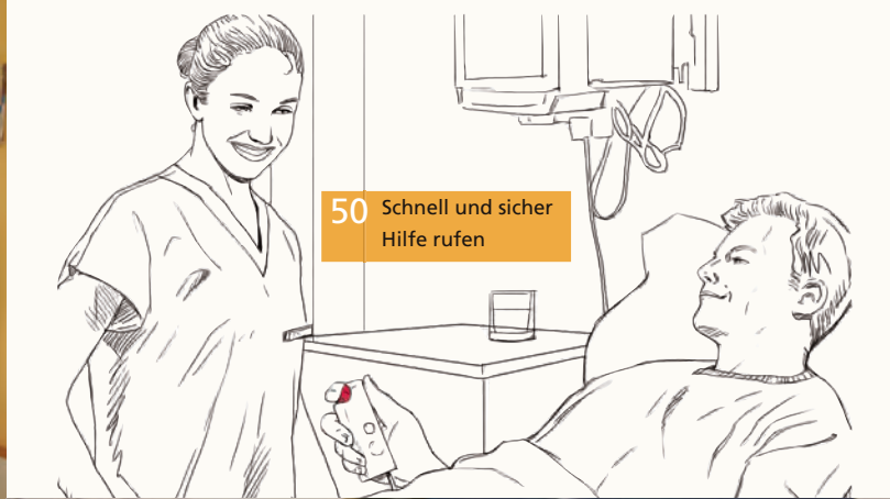
50 Schnell und sicher Hilfe rufen