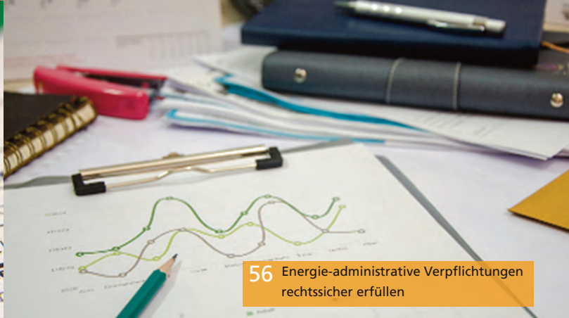
56 Energie-administrative Verpflichtungen rechtssicher erfüllen