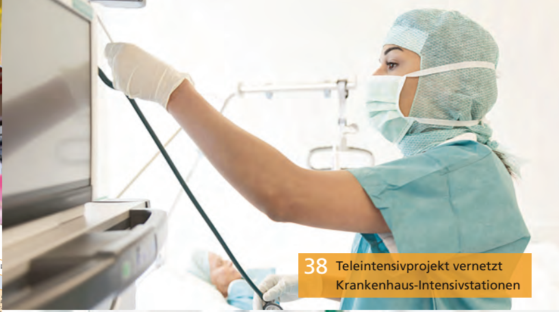
38 Teleintensivprojekt vernetzt Krankenhaus-Intensivstationen