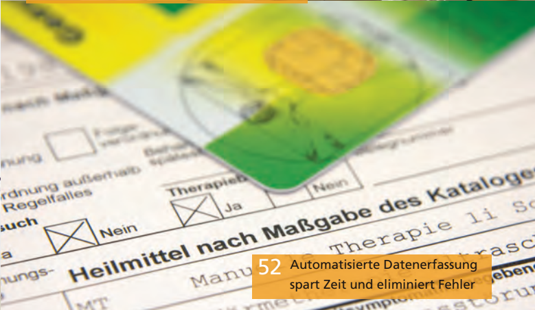
52 Automatisierte Datenerfassung spart Zeit und eliminiert Fehler