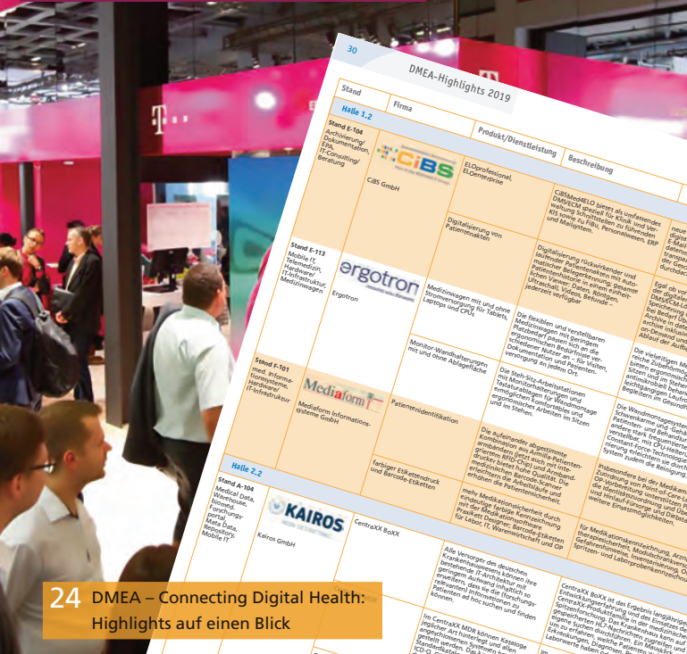
24 DMEA – Connecting Digital Health: Highlights auf einen Blick