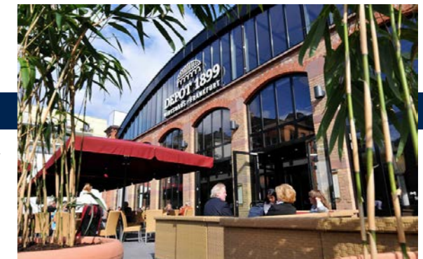
Depot 1899, Frankfurt

17:30 Uhr ENDE DES 1. VERANSTALTUNGSTAGES